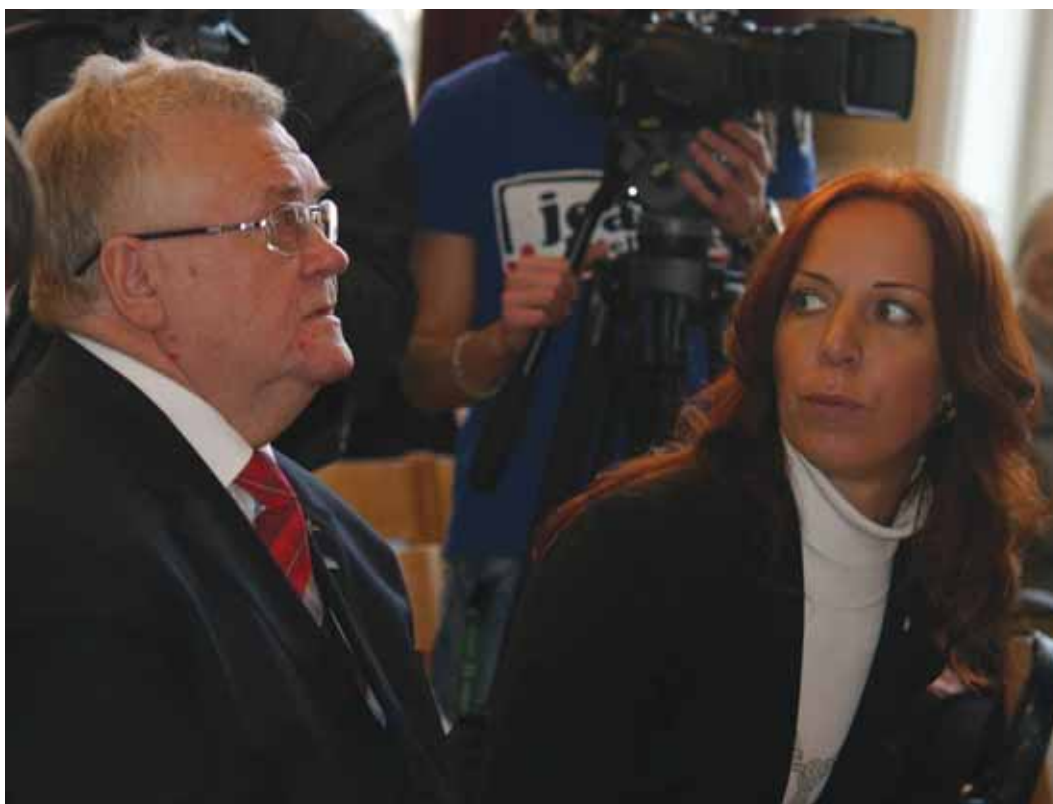
TANDEM: Eesti hariduse devalveerumist püüavad koos õpetajatega takistada keskpoliitikud Mailis Reps ja Edgar Savisaar.

ettekande ühe Keskerakonnast väga kaugel seisva gümnaasiumidirektori sõnadega: „Milleks küll maailma üht paremini toimivat süsteemi nii kergekäheliselt muuta?“ Selle lause autor juhib pikki aastaid Saaremaa Ühisgümnaasiumi ja ütles seda umbes pool aastat tagasi Õpetajate Lehes.