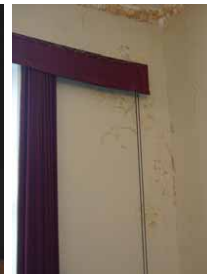
MÕRU TÕÕVILI: Mõni aasta tagasi ligi 100 miljoni eest renoveeritud ilus koolimaja laguneb.