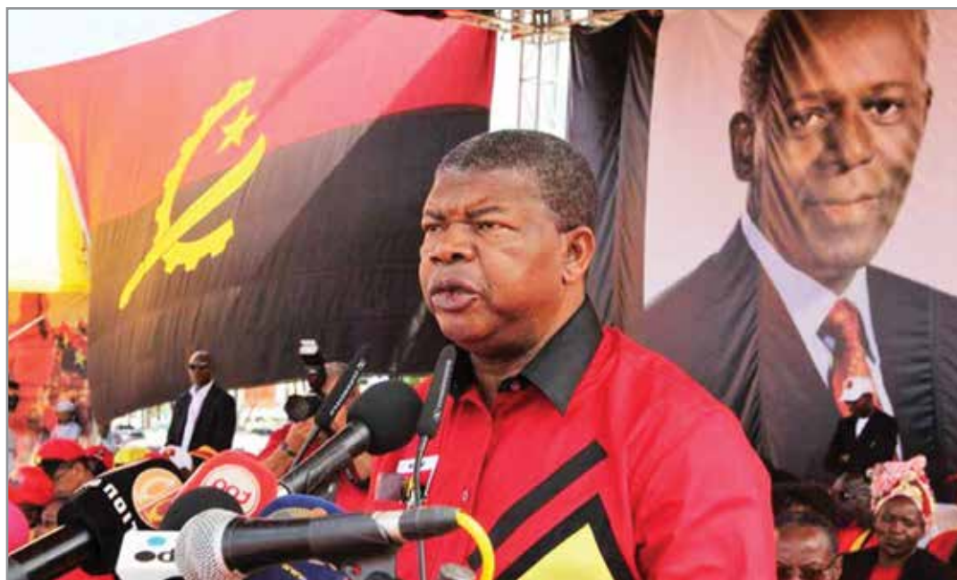
25. augustil võitis Angoola presidendivalimised Tööpartei (MPLA) kandidaat Joao Lourenco. Tema parteikaaslane, Angoola eelmine president Jose Eduardo Dos Santos (taustal plakatil) valitses riiki 38 aastat.

1970-ndatel võimule tulles MPLA hakkas NSV Liidu mõjul üles ehitama riiklikku plaanimajandust ning üheparteilist poliitilist süsteemi, kuid juba 1980-ndate keskel võeti ametlikult suund sotsiaalsele turumajandusele, sest praktika näitas, et plaanimajandus lihtsalt ei toimi. 1991. aastal allkirjastasid MPLA ja UNITA kodusõja lõpetamiseks kokkuleppe, mis nägi ette ülemineku mitmeparteilisele süsteemile. 1992. aasta valimiste järel lahvas verivalamine taas, kuid viimased 15 aastat on olukord riigis olnud suhteliselt rahulik.