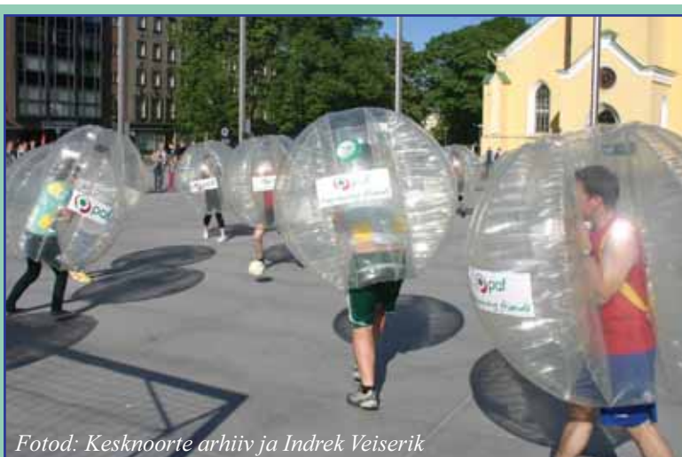
Kesknoored paf-palli mängimas.

vastu. Peale väikest puhkust ja kosutust läks mäng edasi, kuid noorsotsid olid oma strateegiat muutnud ning ründasid meie mängijaid tugevamalt, kasutades ära paf-pallimängu eripära – üksteise vastu pörkamist. Aga ega kesknoored jätnud ka vastamata – mängu-