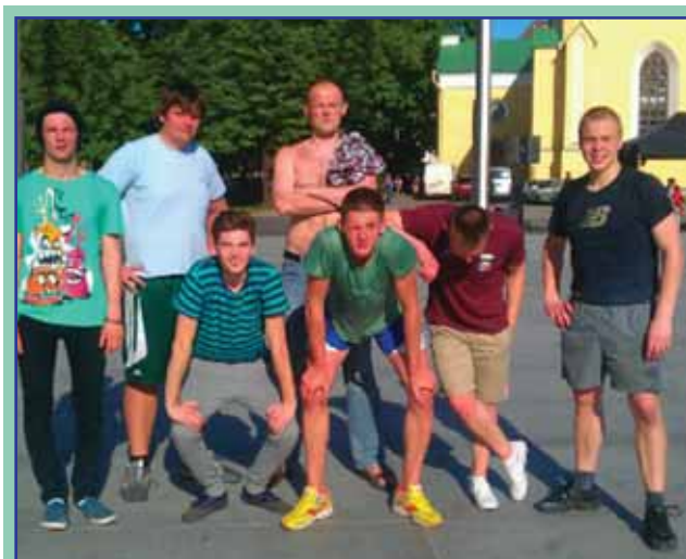
VÕIDUKAD: Kesknoorte võistkond.