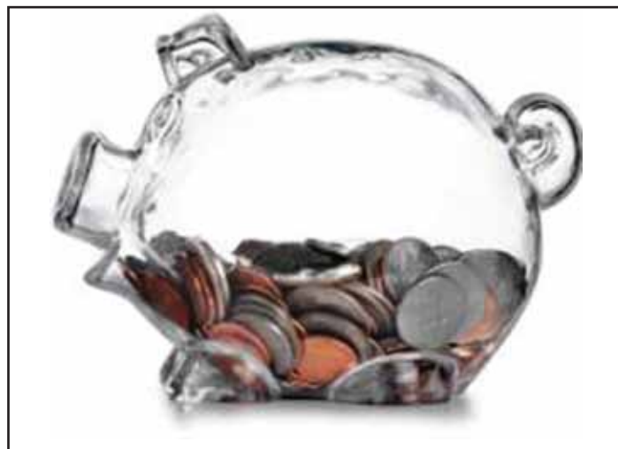
Kes sente ei kogu, see eurosid ei näe.

Samuti võiks iga valija postkasti potsatada ühtse formaadiga või võrdse hinnaga valimisreklaam. Ja ongi kõik. Aga välireklaami ja postkasti reklaami maksumus pidada kinni riigi poolt erakondade eraldatavast rahast. Kohtumised valijatega võiksid aga toimuda vaid liikmemaksumustest laekunud rahade eest.