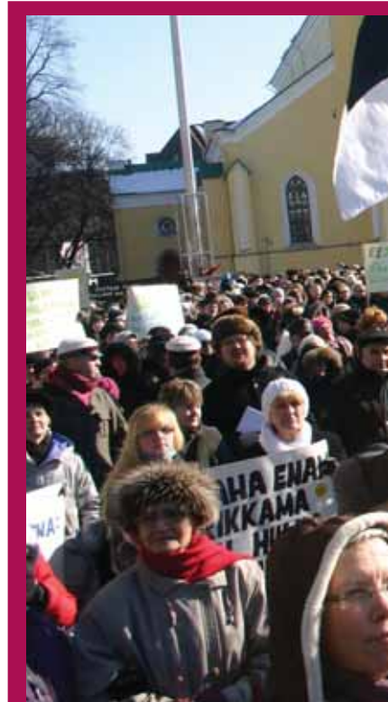
LÕPUKS OMETI: Õpetajate asunud – mis sest, et viimaste

kellad, kunst ja mõnel pool koguni ka laulud.