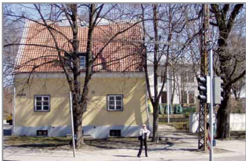
IRL-i KAUAAGNE KONTOR: Wismari 11. Maja müügist saadi tegelikult vaid 48 913 € tulu, osahinguga Magnon leppetrahvist aga lausa 60 716 €.