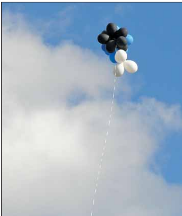
SINIMUSTVALGED ÕHUPALLID LAHKUMAS: Helme kirjutab erakondade vähendamise metoodikast, kuid eriti huvitav on, et vaenatakse just eestikesksemaid erakondi – globaalpoliitika teostajad IRL ja Reform on paipoisid. Arhiivifoto