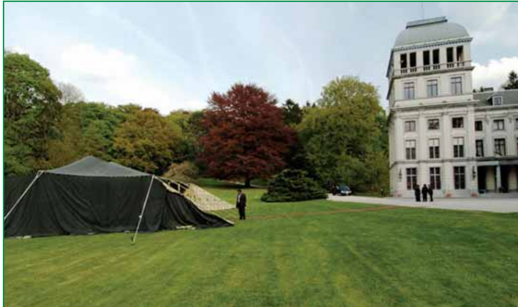
AUSTAB OMA RAHVA TAVASID: Gaddafi on kombeks välisvisiitidele kaasa võtta uhke beduiinitelk. Pildil on ta oma luksusliku elamise üles seadnud 2004. aastal Brüsselis, kui kohtus endise Euroopa Komisjoni presidendi Romano Prodigaga.