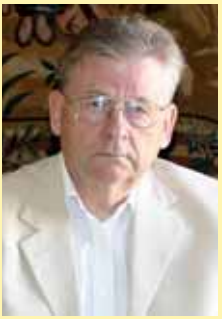
ANDO LEPS õigusteaduse doktor

Praegune Eesti Vabariigi põhiseadus on nii vildakalt koostatud, et rahvas, kelle jaoks see põhiseadus kui kõige üldisem käitumisnormide kogum on tehtud, on sellest praktiliselt välja jäetud.