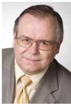
AADU MUST Tartust valitud Riigikogu saadik

Sel nädalal ja veel veebruariski, meie riigi 95. sünnipäeva eel ja järel, räägitakse Eestis tavalisest rohkem Tartu rahust. Räägitakse meie riigi võitudest ja kaotustest, minevikuvaludest ja tulevikulootustest.