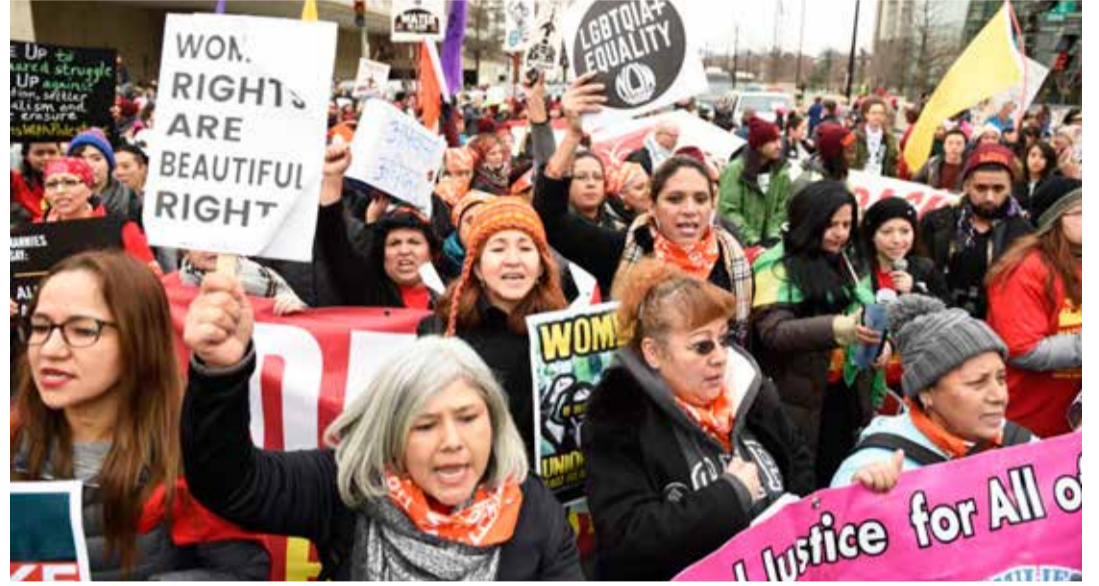
Feministide poolt 8. märtsil Washingtonis korraldatud üritusele „A day without a woman” (Päev ilma naiseta) kogunes 1000 naist.

Hästi, aga naised on kõrghariduse üle võtnud. Hinnatud spet-