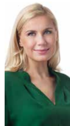
KADRI SIMSON majandus- ja taristuminister, Keskerakond

Eesti Vabariigil on tuleva aasta veebruaris täitumas sajas sünnipäevaring ning suure juubeli eel ootavad meie riiki mitmed väljakutsed. Suurim neist on meie rahva ja riigi kestmine.