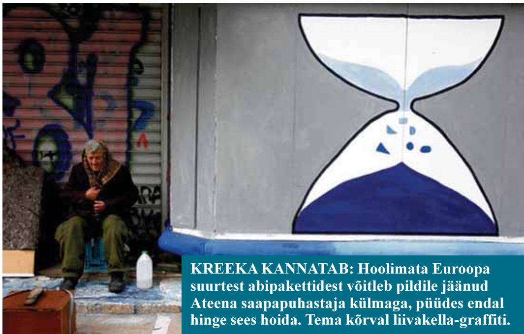
KREEKA KANNATAB: Hoolimata Euroopa suurtest abipakettidest võitleb pildile jäänud Ateena saapapuhastaja külma, püüdes endal hinge sees hoida. Tema kõrval liivakella-graffiti.

Arvestada tuleb, et aprillis toimuvad Kreekas parlamendivalimised, mistõttu pole sugugi kindel, et kärpekava reaalselt ka ellu viiakse. Arvestades