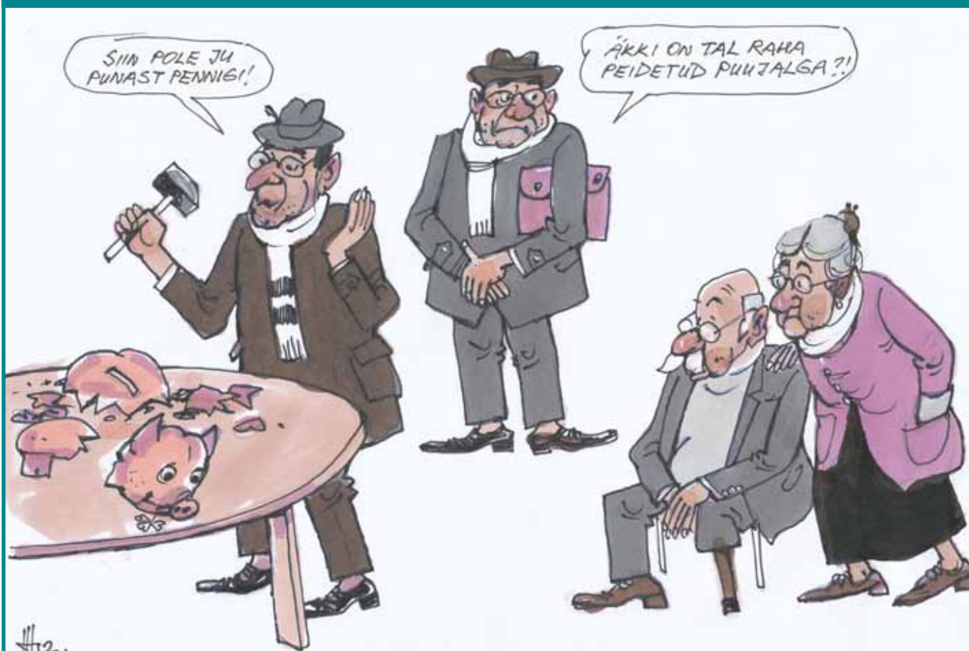
KOALITSIOON PEAB KREEKA ABISTAMISEKS TEGEMA OMAPOOLSEID PINGUTUSI