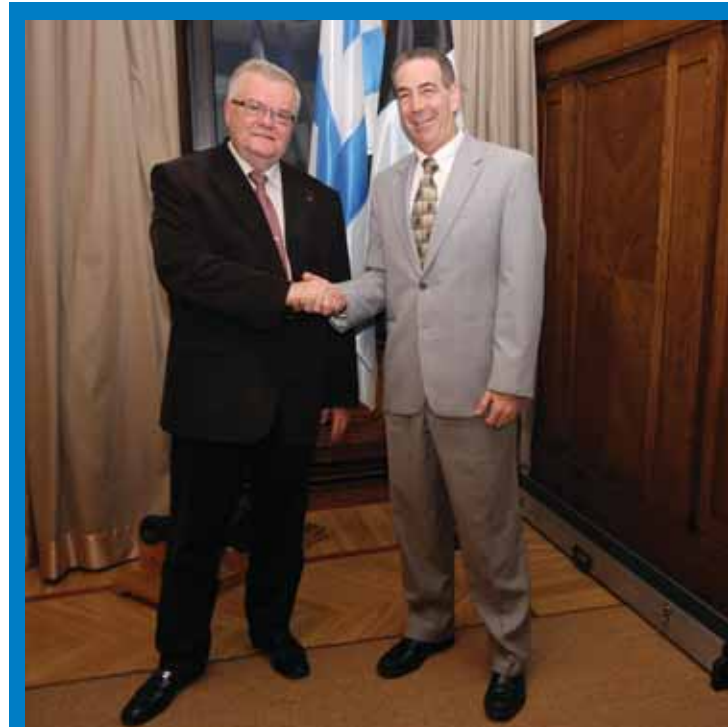
KOHTUMINE: Tallinna linnapea Edgar Savisaar võttis 21. novembril vastu USA suursaadiku Jeffrey D. Levine'i.