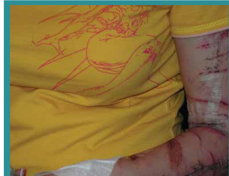
Tänaseks oleme jõudnud Euroopas esiritta. Pildidel tüdrukulõikuma. 1. detsembril tähistatakse maailmas ülemaailms

joobes ja turvaseksivahendite seksuaalvahekorra tõttu. Seepärast on eriti oluline pöörata tähelepanu mitte ainult narkootikumidele, vaid ka alkoholitarbimisele ja toksiko-