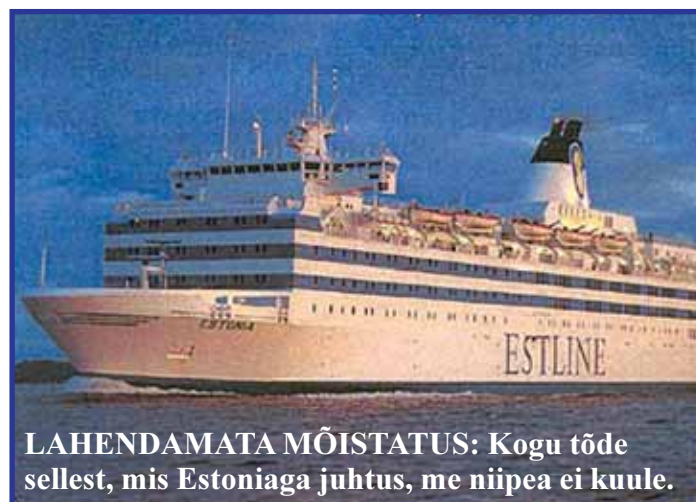
LAHENDAMATA MÕISTATUS: Kogu tõe sellest, mis Estoniaga juhtus, me niipea ei kuule.

17 aastat hiljem pole see traagiline sündmus ikka veel lõppenud. Ilmselt ei lõppegi – vähemalt mitte seni, kuni on olemas ühesed vastused, miks parvlaev hukkus ja kes või mis selles süüdi on. Paljude hinges kripeldab küsimus: kas seda saab siiski õnnetuks pidada? Parvlaeva hukkumist uuriv valitsuse moodustatud asjatundjate komisjon lõpetas tegevuse 2009. aastal. Nende