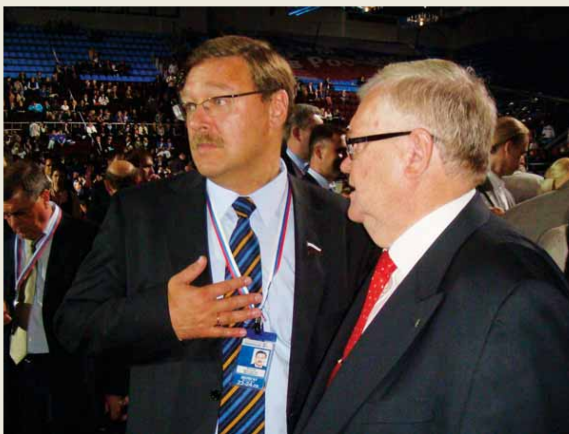
AINUS: Keskerakonna esimees Edgar Savisaar on tänase Eesti ainus poliitik, kes Venemaaga ja Keskerakonna koostööpartneriga, parteiga Ühtne Venemaa mingeidki normaalseid naabrussuhteid püüab edendada. Pildil kohtub Savisaar Riigiduumas väliskomisjoni esimehe Konstantin Kossatšoviga, kellega arutleti Eesti ja Venemaa majandussuhete arengu üle.