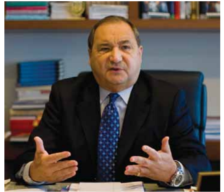
INIMÕIGUSLANE: Abraham Foxmani püüab kaitsta demokraatlike ideaale, seistes vastu antisemitismile.