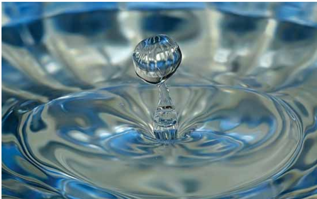
TÜLIVESI: üheks peamiseks tüliõunaks, mis riigikogulased keset puhkust 2. ja 3. augustil tööle ajab, on loomulikult Tallinna veehind. Soov veeteenuste hind kohaliku omavalitsuse halduse alt välja saada paneb suuretevõtjatele lojaalsed koalitsioonipoliitikud higistama ka ilma 30 kraadise kuumuseta.

Meenutame, et 2007. aasta juulis tõusis soojusenergia käibemaks määr 5%-lt 18%-le. Otsus ise võeti vastu juba 2003. aasta 10. detsembril Reformierakonna, Res Publica ja Rahvaliidu valitsuse poolt nelja aasta võrra ette. Lisaks eraisikutele puudutas tollane otsus ka elamu- ja korteriühistuid, kirikuid ja kogudusi ning riigi- ja kohalikest eelarvetest rahastatavaid asutusi. Samas kergitas praegune va-