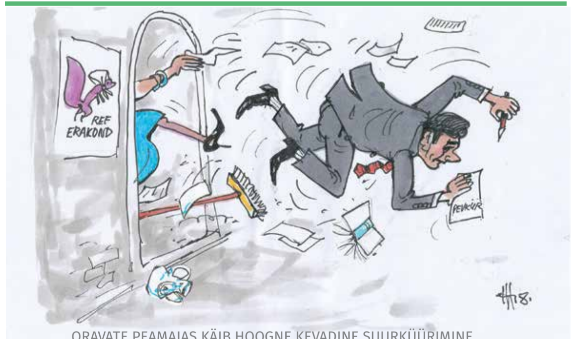
ORAVATE PEAMAJAS KÄIB HOOGNE KEVADINE SUURKÜÜRIMINE