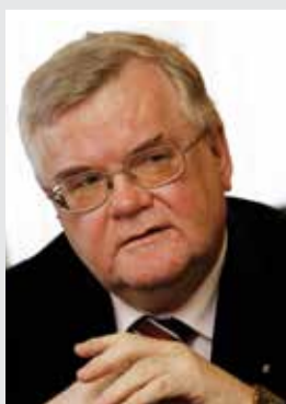
Edgar Savisaar Facebookis

„Mälestame inimesi, kes hukkusid kaubanduskeskuse tulekahjus Kemerovos. Nad olid meie kaasaegsed, neil oleks võinud ees olla pikk ja õnnelik elu, nutame koos nende vanematega. Iga laps, see on laps kogu maailma jaoks. Loodan, et ka meie kirikutes peetakse täna leinajumalateenistusi.“