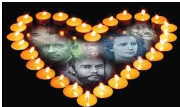
Paljudel tuleb ikka veel südamepõhjast salaohu: „Me ei unusta Sind, Eesti kroom!“

Meel läks kurvaks, kui jälle võis ajalehest lugeda, et Eestis tegutsevad pangad, mis välismaalastele maha müüdud (ei tasu ju pisikesel Eestil pangapidamisega vaevala! eestimaalaste rahasummade keerutamise eest koorivad klientidelt igasuguseid teenustasusid ja teenivad muidu suurt kasumit, aga Eesti Vabariik ei saa dividendidest sentigi. E24.ee kirjutab, et Swedbank Eesti (see endine Hansapank) maksab emapangale Rootsis 243 miljonit eurot dividende, aga kuna sellelt summalt olevat maksud juba