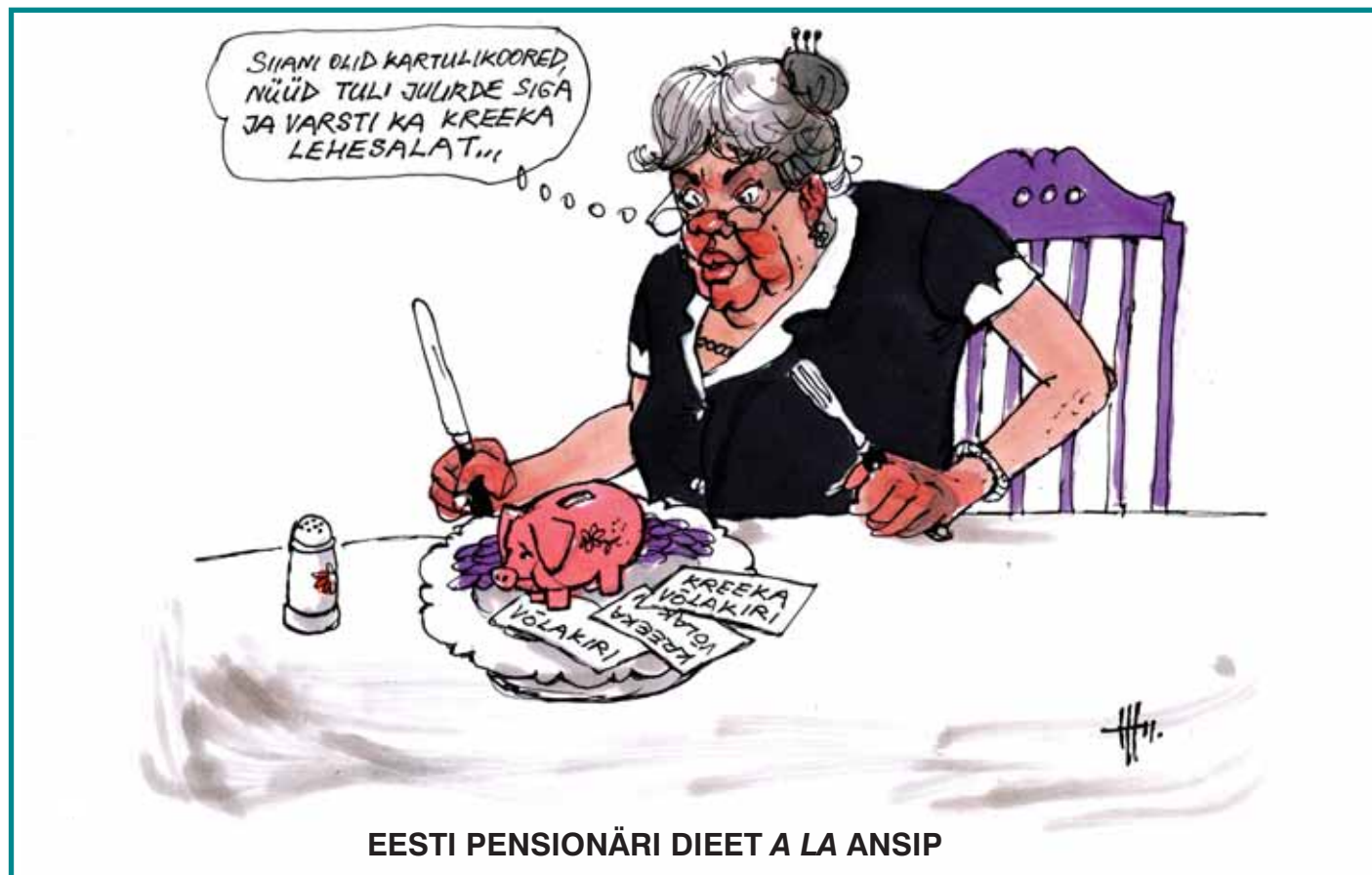
EESTI PENSIONÄRI DIEET A LA ANSIP