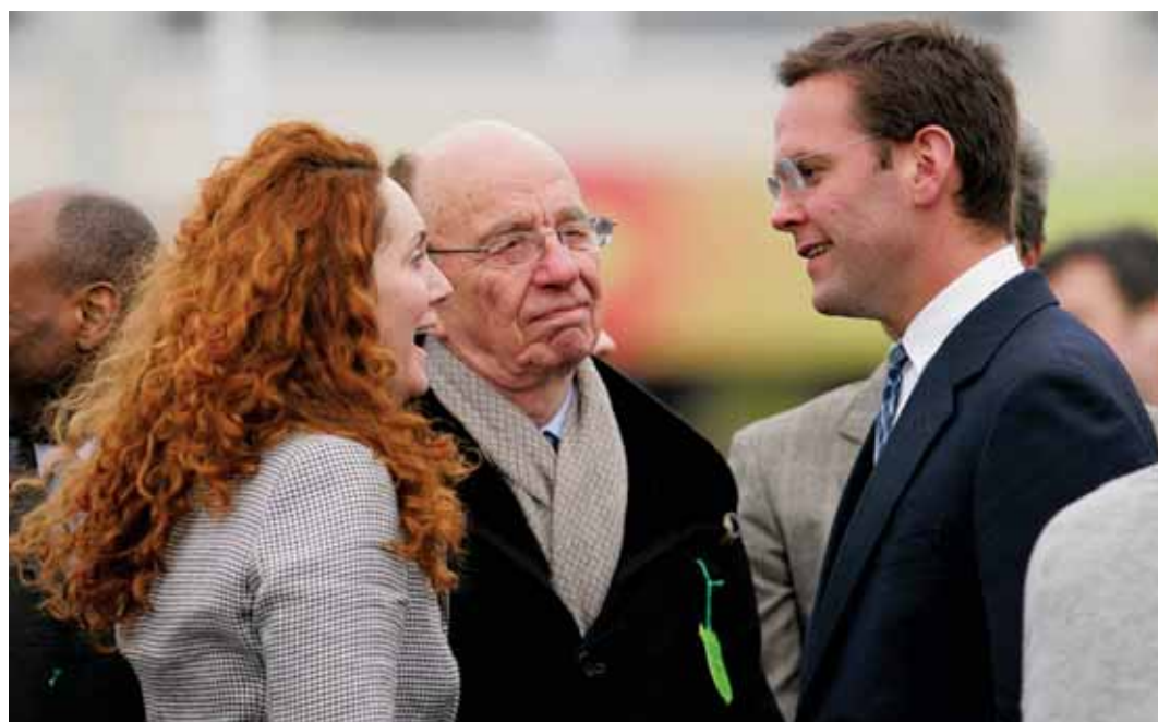
SUHTLEVAD: James Murdoch (paremal) koos oma isa Ruperti ja News of the World'i endise peatoimetaja Rebekah Brooksi.

Meedia-poliitika teljel on Reformierakonnast kõige olulisem muidugi Margus Allikmaa, kes on pendeldanud meediatöö ja poliitika vahel mitu korda. Ja ärgem unustagem ka tema patrooni Rein Langi, Kuku esimest ja kauaaegset omanikku. Mõlemad muide on jõudnud olla ka Tallinna abilinnapead. Politsei-poliitika teljel tuleb