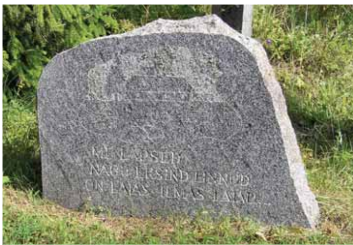
Perekonna mälestuskivi ühest Lääne-Harjumaa kalmuaiast: „Me lapsed nagu eksind linnud on laias ilmas laiali...“

3. Kuidas taastada Eesti maharaiutud metsad, peatada arutu röövraie? Kas põletada Eesti metsad elektriamaades, et elektrit eksportida? Ja samal ajal läheb Eestis küttepuu ja muu puit üha kallimaks. 4. Kas on ennast taevani ülistavale õigusriigile auasi, kui röövmõrtsukas pälvis „kannatanu“ oreooli, aga 88-aastase ohvri poeg tembeldatakse jätkuvalt kahtlusarvuseks? (Isiklik kogemus!) Sest sel riigialamal pole tuhandeid, et osta endale õigustündikadilt, mida põlvede nõtkudes nimetama õiguskaitseks. Või pole sul enam lihtsalt tervist ega ole jäänud piisavalt elupäevigi, et mitmete aastate möödudes vähemalt kohtumaratoni lõpuni jõuda. Parimal juhul võiks ehk rääkida võidupärjast su haual. 5. Kas on normaalne, et tuhanded raskelthaiged peavad mitmeid kuid valude käes piineldes ootama pääsu eriarsti juurde, statsioonarstest ravist rääkimata? Ja 80-aastane üksik vananimene peab ise leidma võimaluse 60–70 km taha tohtri juurde või haiglaravile pääseda? Sellisest „tühiasjast“ nagu hambaravi ei tasu rääkida.