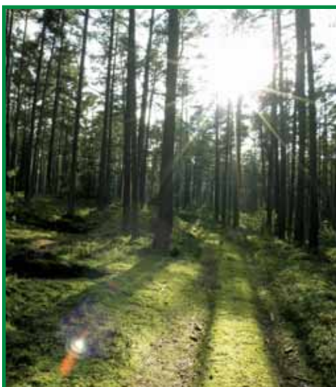
METS ON TALU KAPITAL: Kas sel noorel kuusikul õnnestub kord ka põlislaaneks saada?

Kui sõltumatud siis tegelikult on need sõltumatud riigiasutused? Kui juhuslik või suunatud on