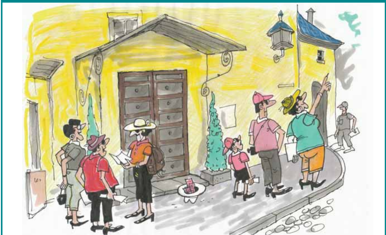
TALLINN. SUVI. STENBOCKI MAJA. KERJAKÜBAR.