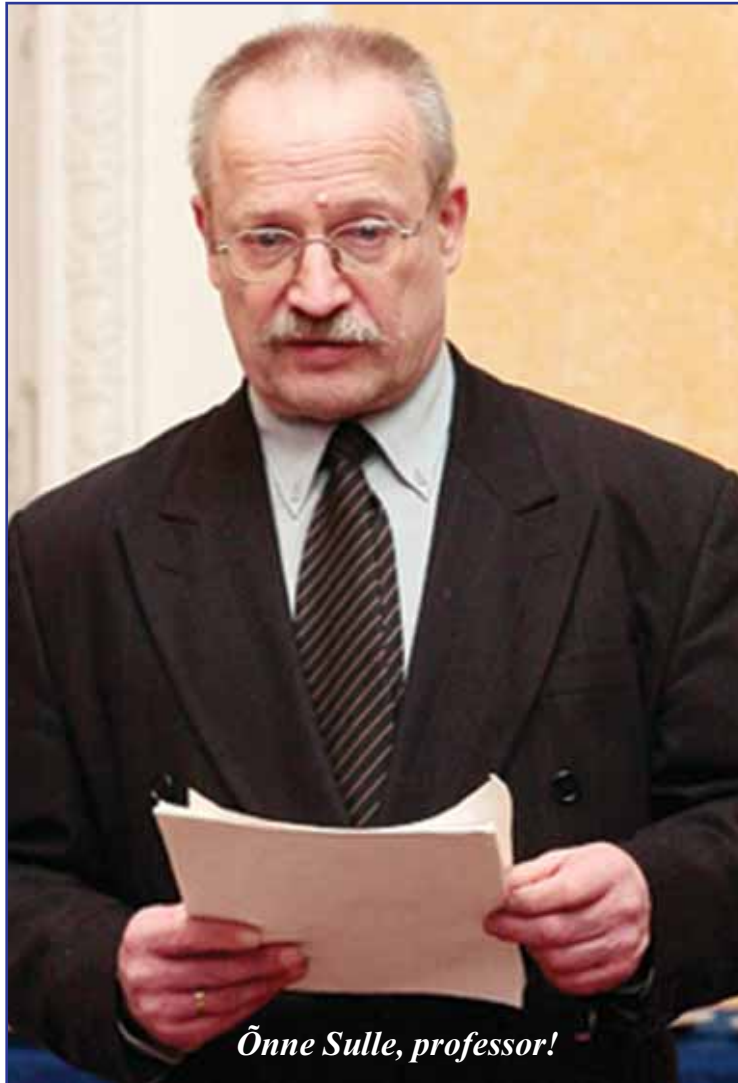
Õnne Sulle, professor!