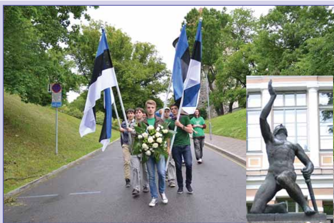
NOORED NOORTELE: Ainus, kes pidas võidupühal tegudega meeles Reali Poisi, oli Keskerakonna Noortekogu.

Kesknoorte pressiteatest, Kn Fotod KE Noortekogu arhiivist