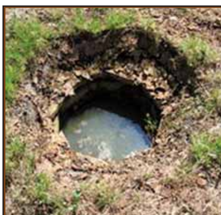
HULLEM KUI HUNDIAUK: Kui tõeline hundiauk varitseb kiskjaid, siis see neelab valikuta kõiki. Kas tõesti ongi siin inimene inimesele hunt?