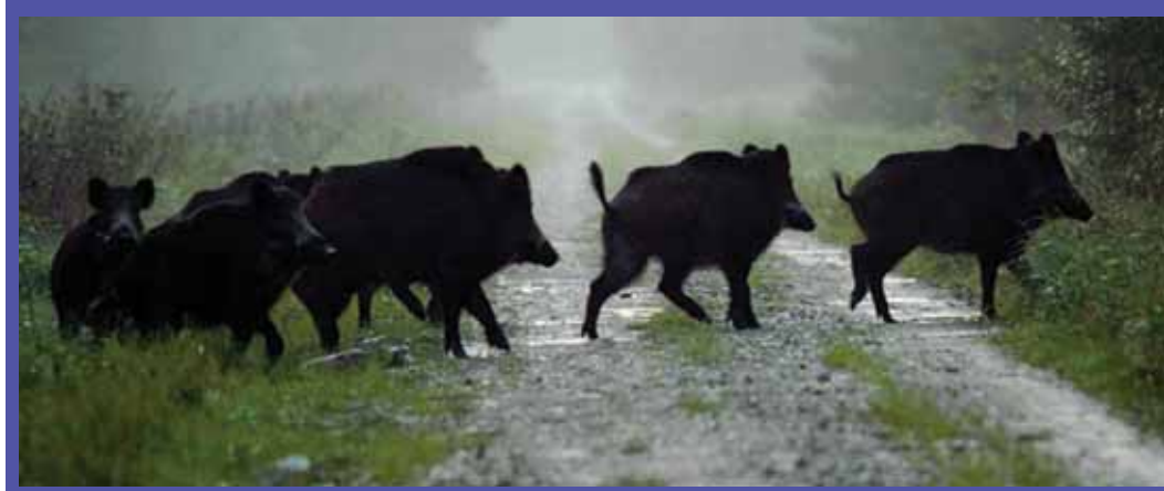
AHVATLEV MAA: Eesti on muutumas rikkuristide looduspargiks, kus soovitakse asuda korraldama massiivset jahiturismi.

Rahvaliit vähemalt püüdis kaitsta meie maid ja metsi. Kuid mida teevad praegu ülejäänud huvigrupid ja nn