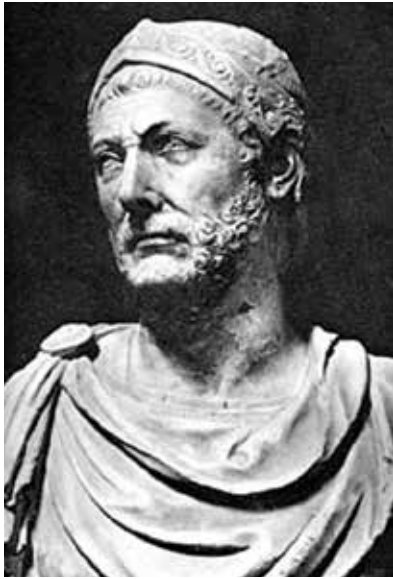
Kas Hannibal oleks vääriline eeskuju?

Kas võime Eesti pinnal arvestada üsnagi väljakujunenud üheideoloogia- lise diktatuuriga, mille tagajärjed võiksid kahjustada kõigi Eestimaa rahvaste huve? Siin siis on eestlaste ja vene kogukonna ühisosa: panna seljad kokku ja tõrjuda liialt ahista-