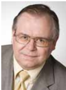
AADU MUST professor, Riigikogu liige

Riigijuhtide kõige lihtsam vastus on: õpetajad, me küll hindame teie tööd, kuid riigil raha ei ole ja palka tõsta ei saa! Sellist selgitust on haridustöötajad ja päästetöötajad ning ka meditsiiniõed pidanud kaua kuulma. Kuid kaua sa kannatad – niikaua, kuniks jõuad olukorda, kus töötasu ei kata enam isegi eluasemekulusid? Kes vastutab selle eest, et riigieelarves puuduvad vahendid juba aastaid külmutatud palga tõstmiseks? See on olnud valitsuse poliitiline valik – üliliberaalse “õhukese riigi” poliitika.