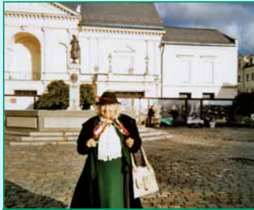
Klaipeda on vanimaid linnu Leedus. Leedulaste esivanemate asula (teateid 1. sajandist) kohale rajas 1252. a linnuse Liivimaa ordu. Siinkirjutaja selja taga vana raekoda ja neitsi Anna kuju.

Eriti vapustas kuurortlinn Neringa oma kordumatu loodusega. Võrattu on imeliste liivaluidetega maasäär Läänemere ja Kura lahe vahel. Juodkrante ja Nida oma uudsel ilmel tunduvad sobivat pigem Saksa või Šveitsi maastikku. Ainulaadses meremuuseumis lõbus-tasid kõiki elegantne pingviinide paraad, mis vägagi tuletas meelde meie riigi aastapäeva pidulikku tähistamist, ja merelõvide kontsert. Palangas väärib tähelepanu kunagine krahvipalee, kus nüüd on kuulunud merevaigumuuseum.