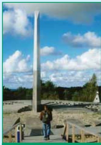
Nida hiiglaslik päikesekell.

Raekoja ees köitis pilku linna romantilise kaitseingli neitsi Anna kuju. Viimasel külastuspäeval saime osa Palanga suvelõpulaadast –