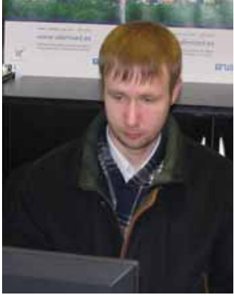
VIRGO KRUIVE MTÜ Eurosaadik

1. aprilliks pidid kõik omavalitsused avalikustama möödunud aastal oma töötajatele makstud palgad. Kindlasti pakub lugejatele huvi, kes neist enim teenis ja milline omavalitsus oli palgaga heldeim.