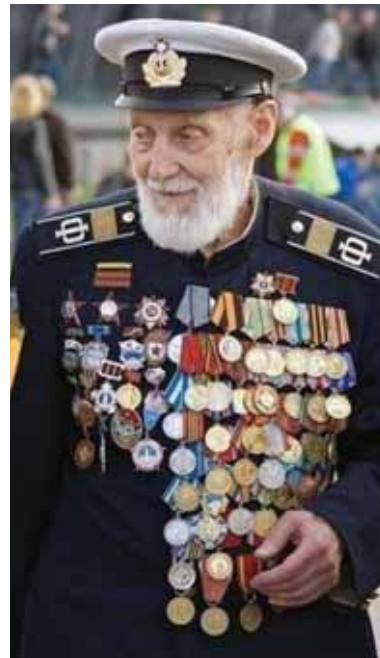
VABASTAJA VÕIANASTAJA: Suurema osa maailma jaoks on see mees maailma kurjusest vabastaja, mõne jaoks kurjategija.

lapsed koolis õigete ajalooõpikute järgi õppima. Ajalugu pole tõesti täppisteadus, nagu näiteks matemaatika. Kuid Teise maailmasõja kohta on levinud hulk ju lausa üksteist välistavaid traktaate! Kui järgida Laari välja pakutud ning Kelami toetatud käsitlust, jääb arusaamatuks nii mõnigi moment. Esiteks see, kedakujutasid endast tegelikult Roosevelt ja Churchill, kes teatavasti olid ju Teises maailmasõjas Stalini liitlased. Kui järgida Laari–Kelami loogikat, polnud nad mitte maailma vabastajad fašismist, vaid kurjategija käsilased. Samuti jääb arusaamatuks, mis sündmusest võttis Moskvas osa Eesti Vabariigi president Toomas Hendrik Ilves. Eeldati, et ta sõitis võiduparaadile, millest võtsid osa Suurbritannia, USA, Prantsusmaa ja Poola ning