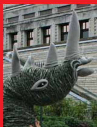
Ninasarvik Rahvaliidu kongressi rõdul Lk 2-3