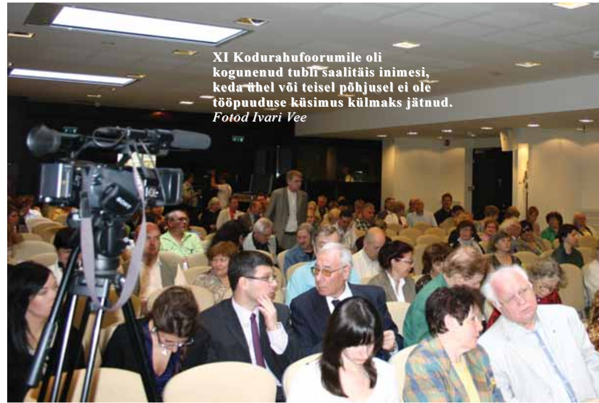
XI Kodurahuforumile oli kogunenud tubli saalitäis inimesi, keda ühel või teisel põhjusel ei ole tööpuuduse küsimus külmaks jätnud.

Tulevikuperspektiivide suhtes polnud akadeemik kuigi optimistlik, sest majandust uuesti käima tõmmata olevat küllalt raske – eelkõige seetõttu, et meil puuduvad majanduse rahastamiseks elementaarsed