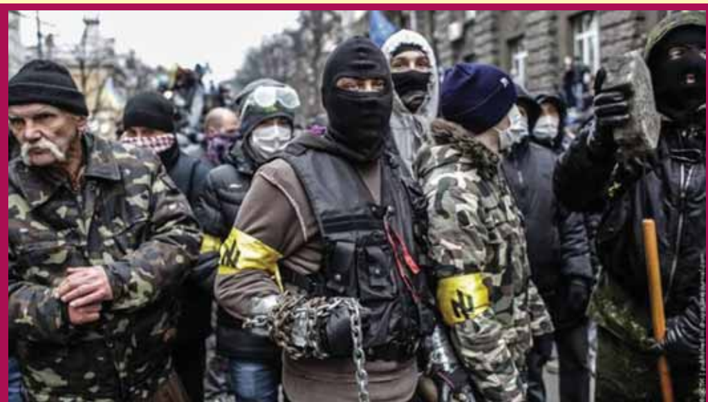
“RAHUMEELNE” MAIDAN: Fašism ei tõsta pead mitte ainult Ukrainas, vaid laiemalt kogu Euroopas. Kas mitte ka Eestis?

peavoolumedia ja hulk kultuuritegelasi, kes õigustavad vägivaldseid ja ebademokraatlikke tendentse Ukrainas. Seal on praegu võimul selgelt fašistlikke, negatiivseid ideale propageerivad jõud. Nimekirja tuleks