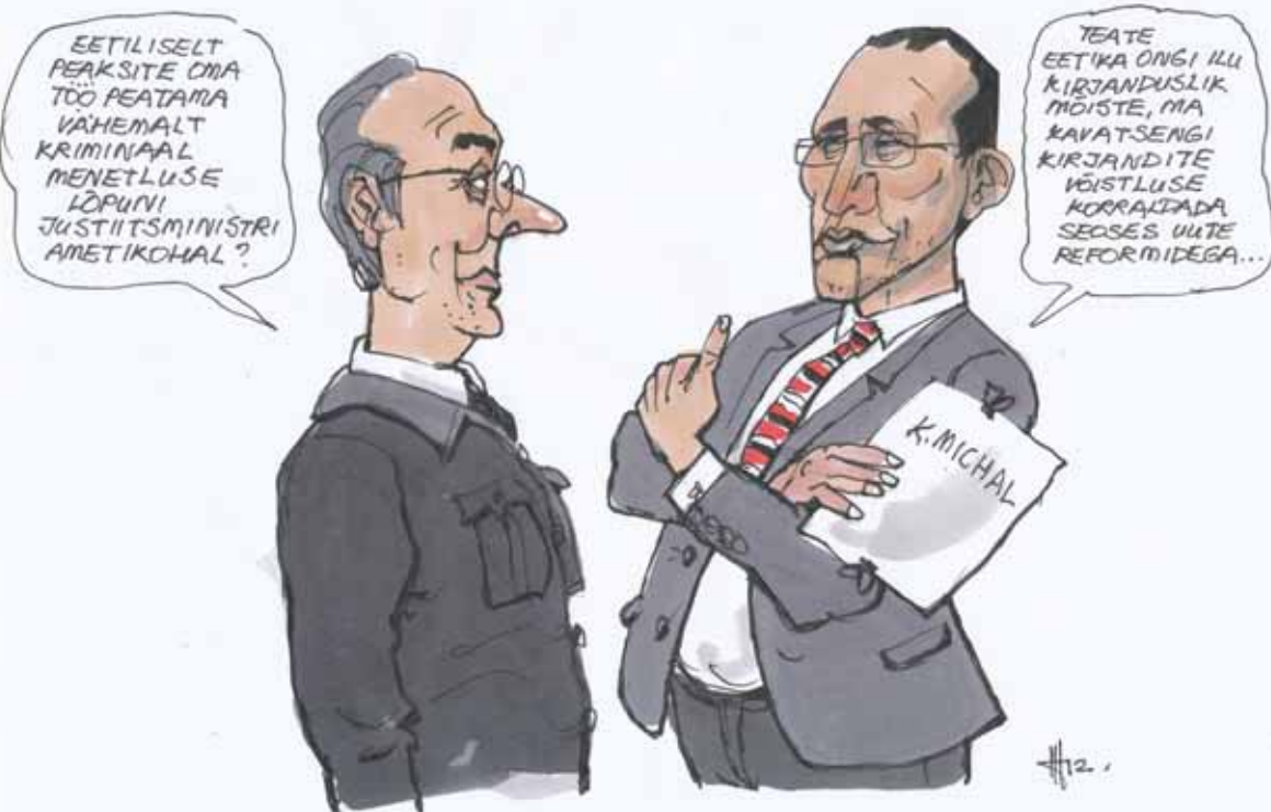
TÕDE JA ÕIGUS EESTI MOODI