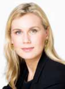
KADRI SIMSON Riigikogu kesksfraktsiooni esimees

Üks Euroopa abipakett EFSF on asendamas teist alalist päästefondi ESM ning juba viis eurotsooni riiki seitsmeteistkümnest on ise abisaaja rolli langenud. Sellises olukorras väldib Eesti valitsus kõikvõimalikel viisidel sisulist arutelu Eesti osaluse üle teiste riikide laenude garanteerimisel ning annab avalikkusele selgitamata käendusi, mis võivad Eestile aastate pärast koormaks osutuda.