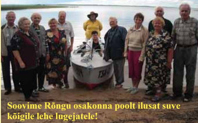
Soovime Rõngu osakonna poolt ilusat suve kõigile lehe lugejatele!

kes on iga kuu toimuva koosoleku jaoks üksteisele alati olemas ning pea tegusaid mõtteid täis. Seekord otsustasime, et võtame seda tõsiasja vabas looduses ja oma Eestimaa ilu nautides. Pean ütlevat, et ma ise tubli olen, siis Rõngu osakonna liikmed on väga tublid – need, kes lubavad tulla, need ka alati koos. Juba aastaid saame traditsiooniliselt iga kuu kokku. Teemasid jätkub kodukülalt, vallast kuni riigivõimuni välja. Nukraks teeb karm tõsiasi, et kuigi meie, eakad, oleme alati vapralt kõigi Eesti elu teemade üle sügavalt arutlemas, siis nooremad meie liikmed, kes oma igapäevaprobleemides siplevad, ei leia kuidagi aega kohale tulla.