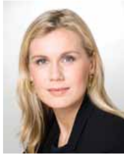
KADRI SIMSON Keskerakonna aseesimees, Riigikogu Kesksraktsiooni esimees

Möödunud nädalal arutati Riigikogus tuleva aasta eelarvet. Täiesti teadlikult võttis Keskerakond arutelu tempo maha. Me ei soovi, et riigi tähtsaimat dokumenti menetletaks kiirkorras. See jätkaks mulje, et valitsusepoolsete maksumõjude mõjul vohama läinud hinnatõus on paratamatu ning riigieelarve täitmise linnade, valdade ja perede eelarvete pealt ainuvõimalik.