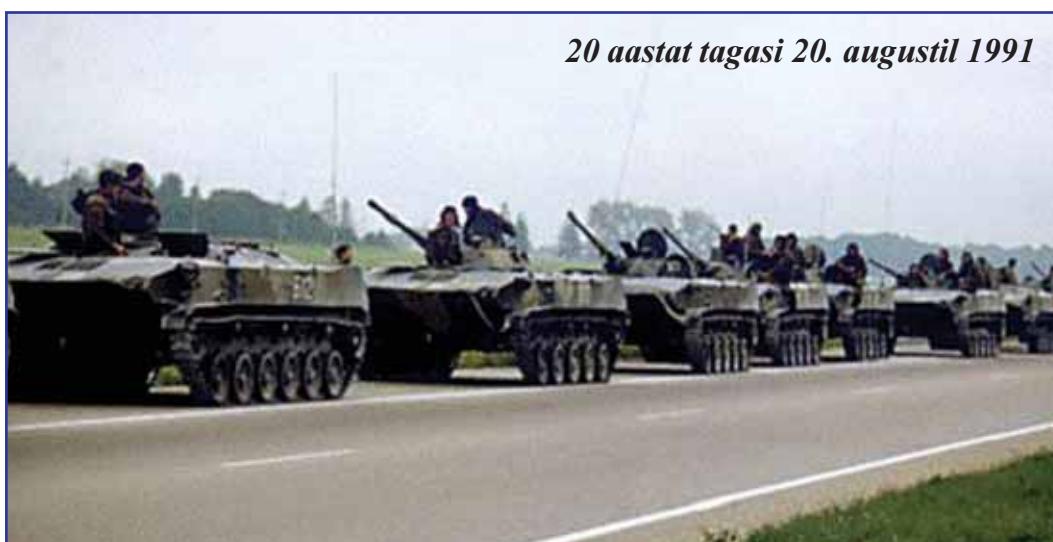
20 aastat tagasi 20. augustil 1991

Pärast 15. maid 1990, kui intrite rünnaku Toompeal lõpetas valitsusjuht Edgar Savisaare raadiopöördumise järel valitsus kaitsema tulnud rahvahulk, moodustati organisatsioon „Eesti Kodukaitse“, mille üles-