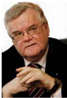
EDGAR SAVISAAR Keskerakonna esimees