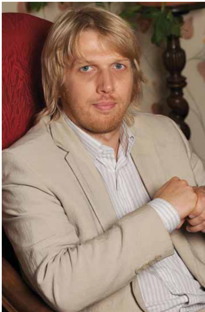
TULEVIK VASAKPOOLSEM: Karilaine meelest vajab Eesti vasakpoolsemat peaministrit ja sotsiaalsemat valitsust.