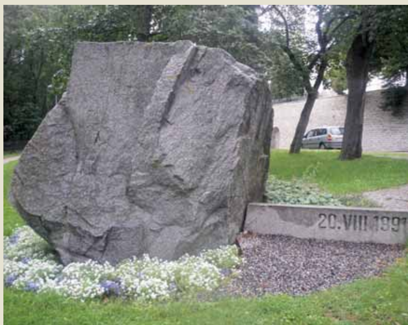
ÄREVATE PÄEVADE TUNNISTAJA: Üks nimetu graniitrahnu jäeti Toompeale alles, mälestuseks barrikaadidest ja võitlustest 19.-20. augustil 1991.

Eesti Vabariigi Ülemnõukogu õhtusel istungil, vaatamata Eesti Komitee ja Rahvarinde saadikute erimeelsustele paljudes küsimustes, jõuti lõpuks kokkuleppele ja kell 23.00 pani Ülo Nugise hääletamisele otsuse „Eesti riiklikust iseseisvusest”, mille vastuvõtmise poolt hääletas kell 23.03