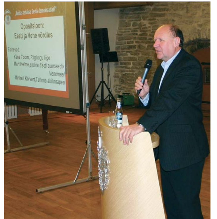
Mart Helme esinemas konverentsil „Opositsioon: Eesti ja Vene võrdlus“ 1. novembril 2012. aastal.

Rahvusvahelised suurkorporatsioonid ja nende teenistuses olevad valitsused on midugi huvitatud, et Eestis jääks kõik nii nagu on, ja seepärast on lahti lastud kiidulaul ka Eesti edule. Aga vaata palja silmaga või luubiga – edu ei ole. Ja see, mis 90. aastatel oligi edu, on praeguseks peaaegu viimase sulanud, nii et nn saatusekaaslastel meil juba vägisi kandadel tallavad ja mõned neist peagi meist ilmselt ka mööda lähevad. Kui ei tule muutusi poliitilises juhtimises ja majanduslikus mõtlemises, on Eesti tulevikuks vältimatu muutumine külmavõetud banaaniiks.