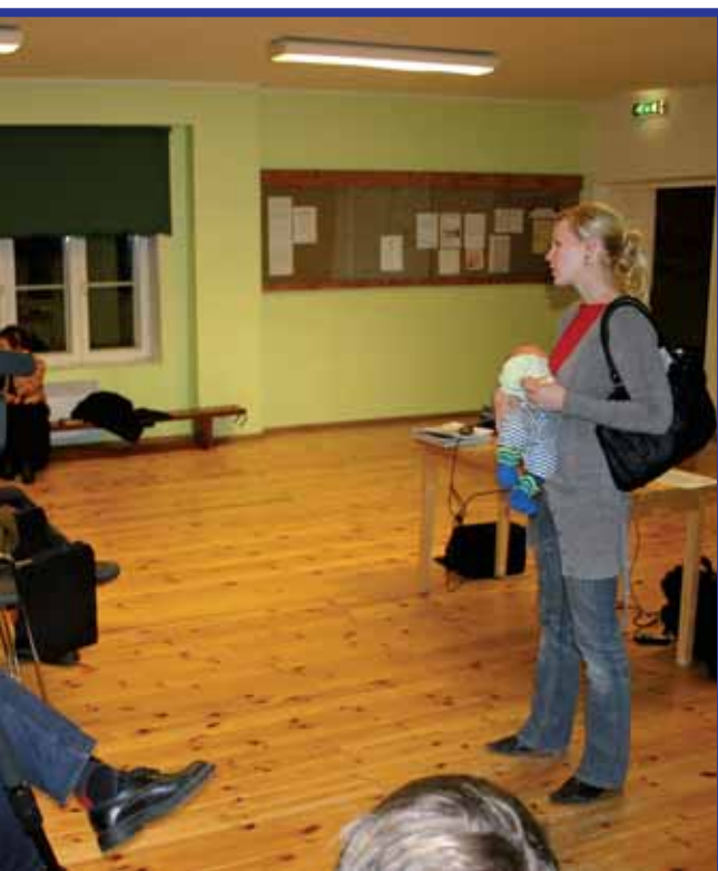
Miila külas elav noor ema koos beebiga pidas kurtis Eesti riigi olematu regionaalpoliitika vustamas seda videokaameraga oma tulevase

Lisaks loodab kohalik rahvas väga oma praeguste vallajuhtidele, et need säilitaks meelekindluse ega alluks VKG manipulatsioonidele. (Nelja Lääne-Viru valla juhtidel läheb raskeks, sest Kesknädalale on sahistatud: peaminister Andrus Ansip käis kuu aega tagasi Virumaal ja kiitis VKG poolt tehtavad uuringud heaks.)