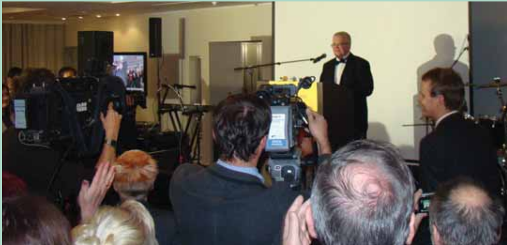
MAGUS HETK: Keskerakonna esimees ja Tallinna linnaapea Edgar Savisaar oma Tallinna valimisvõidu järgset kõnet pidamas.