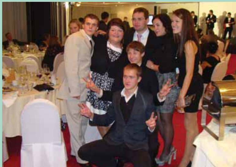
RÖÖMSAD TULEMUSTE TEADASAAMISEST: Pildil vene noored, tänu kellele suur hulk inimesi kojujäämise asemel 20. oktoobril hääletama tulid.