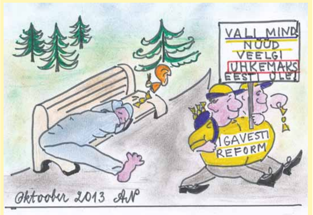
Joonistanud Anne Noevere (Tallinn-Mustamäe)