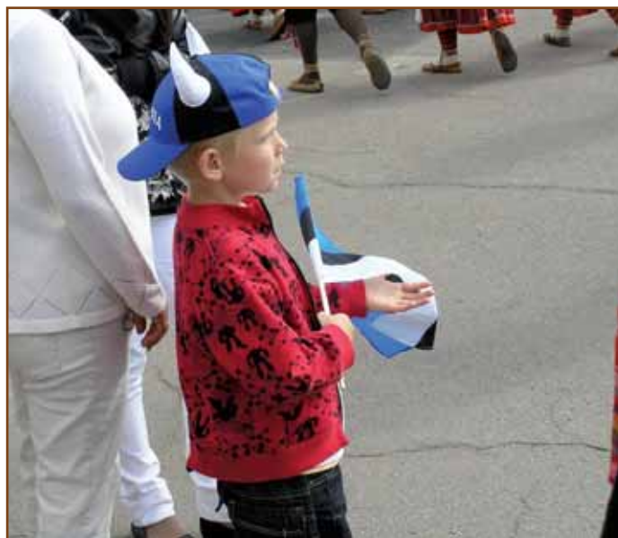
Sellistest poistest sirgub tublide õpetajate käe all vingeid tantsuvendi, kes suhtuvad ellu ja kaas-inimestesse väärt meestena.