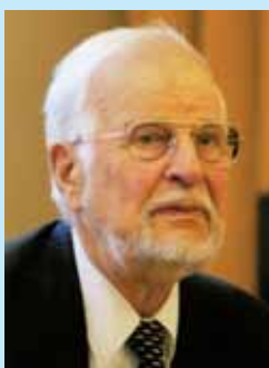
UNO KIVIK Harjumaa

Meil ollakse uhke, et Eesti on ainus riik, kus tavalise valimisviisiga kõrvuti eksisteerib võimalus valida riigiorganeid interneti kaudu.