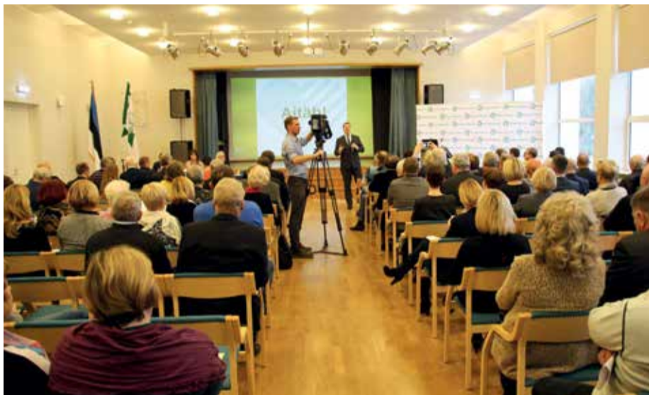
VOLIKOGU SEAB EESMÄRGID: Keskerakonna volikogu võttis laupäeval vastu avalduse, milles seatakse eesmärgiks eakate inimeste heaolu parandamine.

erakond teha üle riigi 101 rahvakohtumist, et valimisprogramm lähtuks Eestimaa inimeste tahtest. Erakonna esimees märkis: Keskerakond on alati olnud koos inimestega ja töötanud eestimaalaste heaks, ning seetõttu soovetakse ka programm teha üheskoos.