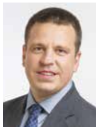
JÜRI RATAS Peaminister, Keskerakonna esimees

Eesti Keskerakonna juhitud valitsus tähistab 23. novembril oma esimest sünnipäeva. See aasta on kindlasti olnud väga tööne, sest seadsime valitsust koostades endale neli olulist, aga ambitsioonikat eesmärki, mida peavad otseselt ja kaudselt teenima kõik meie tehtavad otsused. Nendeks eesmärkideks on suurendada Eesti rahvaarvu, parandada ühiskondlikku heaolu ja sidusust, välja murda majandusseisakust ja tagada meie pikaajaline kasv, hoida ja tugevdada meie riiklikku julgeolekut.