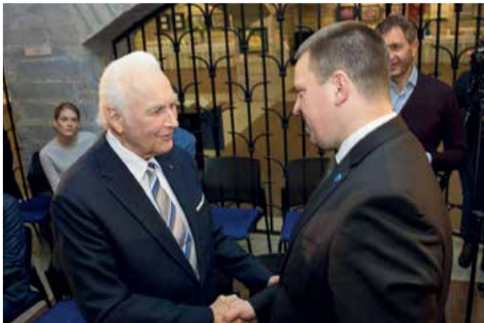
Peaminister Jüri Ratas tervitamas Arnold Rüütli.