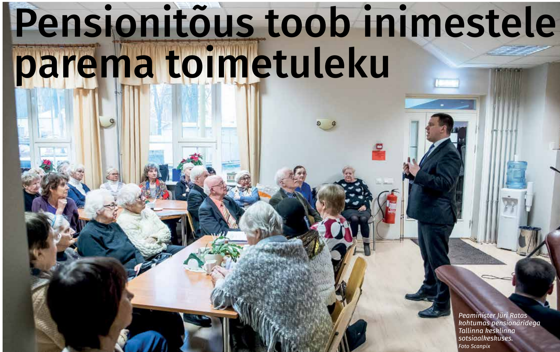
Peaminister Jüri Ratas kohtumas pensionäridega Tallinna keslinna sotsiaalkeskuses.

Selle aasta 1. aprill toob pensionäridele viimase kümne aasta suurima pensionitõusu – keskmiselt 7,6%. Eelmisel neljapäeval kinnitati vabariigi valitsuse istungil riikliku pensioni indeksi väärtuseks 1,076, mille tulemusel kasvavad pensionid keskmiselt 7,6 protsenti. See jätab pensionäridele rohkem raha kätte ja parandab toimetulekut.