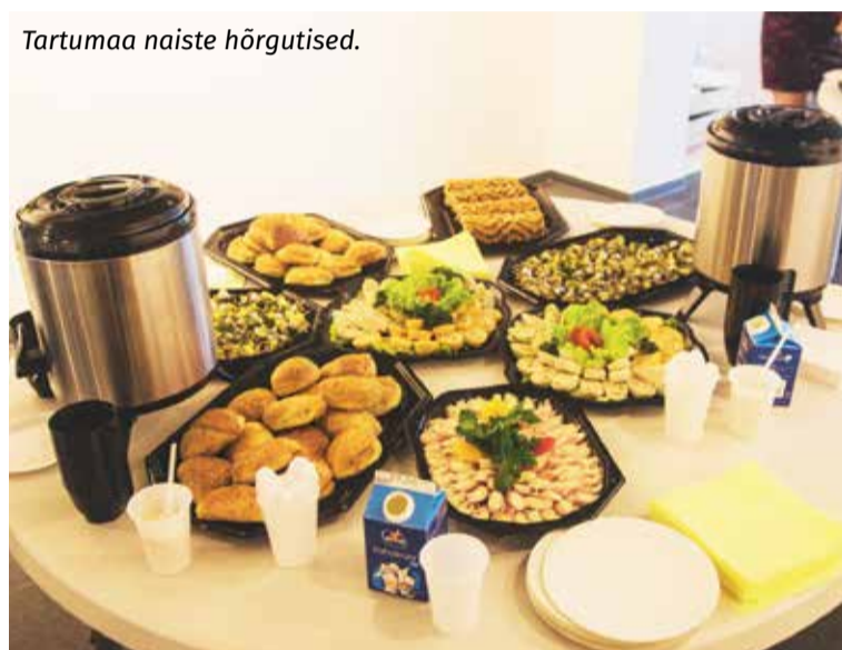
Tartumaa naiste hõrgutised.

ja messidel käimine ökonoomsem siis, kui seda tehakse ühistevõime abil.