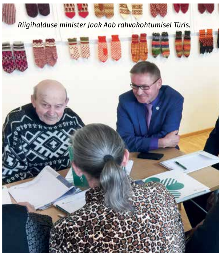
Riigihalduse minister Jaak Aab rahvakohtumisel Türis.

Pensionitõusu üheks katteallikaks saab lisaks astmelisele tulumaksule olla majanduskasv. Valitsuse majanduspoliitika, investeringud ja piirkondade arengusse panustamine on seda