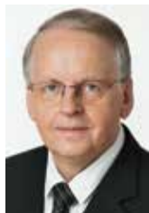
ENN EESMAA Riigikogu aseesimees

Jõuluuag tuleb kõigile igal aastal meelde, kui väga vajab igaüks meist valgust, soojust ja lähedust. Avaneb otsekui ajatunnel, mille ühes otsas oleme meie, teine ots aga tähistab aegade algust, kõiki neid inimõlvi, kes enne meid elanud ning omas ajas pimedusejõudude kiuste valgust ja lähedust ihanud.