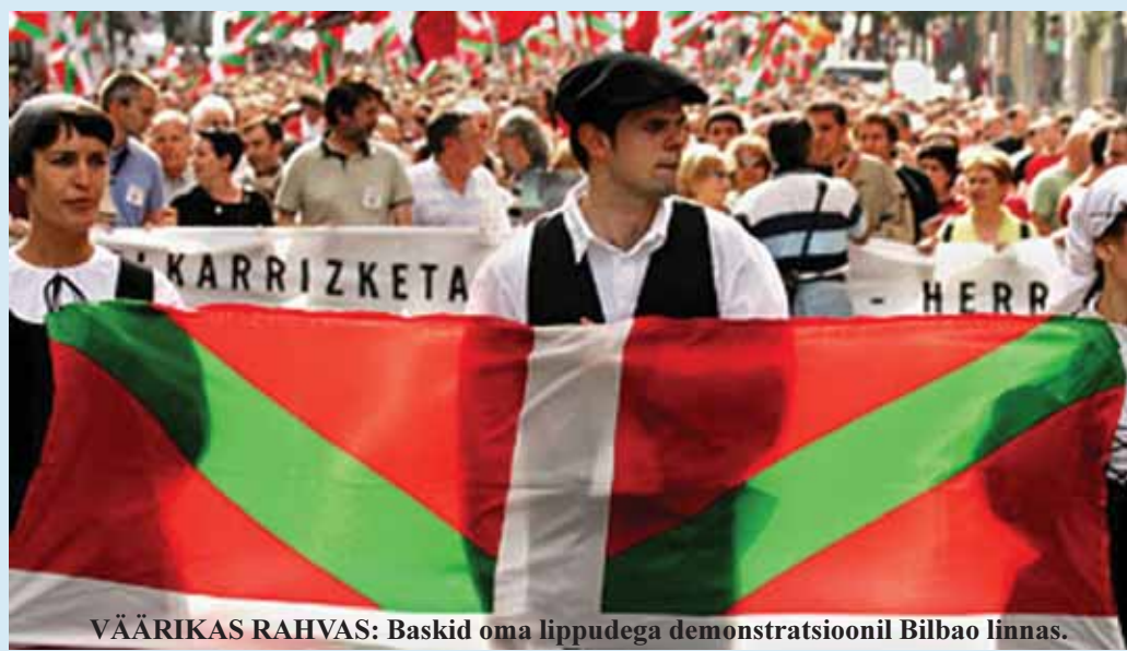
VÄÄRIKAS RAHVAS: Baskid oma lippudega demonstratsioonil Bilbao linnas.