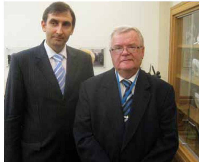
NAABRIMEHED: Venemaa põllumajanduspoliitik Vassili Kopõlev ning Eestis maarahvakongressi korralduse algatanud erakonna esimees Edgar Savisaar Paide raekojas 8. oktoobril.

tootmise kasvutemposid, suudame mitte ainult et rahuldada riigisiseseid vajadusi, vaid alustada ka ekspordi – ning see on selle haru puhul uudis. Muide, tänavu 7 kuuga kasvab lihatootang 8%.