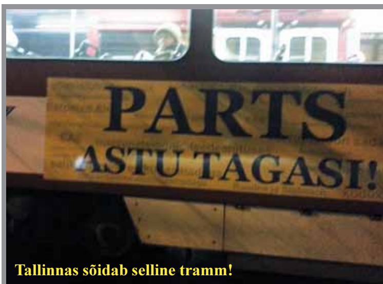
Tallinnas sõidab selline tramm!

MTÜ Lilleküla Selts esitas selgitustalutuse 20. veebruaril Konkurentsiametile ning Rahandus- ja Kommunikatsiooniministeeriumi koostatud riigiabiluba taotlust ka sellises kontekstis, milles alandati tarbijatele pandud tasusid 10%.