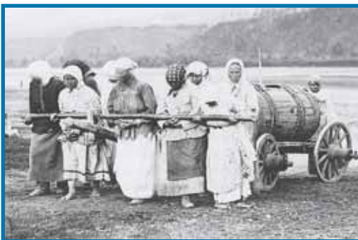
ÜKS PALJUDEST PILDIDEST: 1900. aasta seaduse kohaselt naissunnitöölisi kaevandustes maa-alla ei tohtinud saata, neile leiti maapealset tööd. (lk. 251)