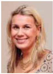
KADRI SIMSON Riigikogu Keskerakonna fraktsiooni esimees

Mööduv aasta oli muutlik ja pingeline poliitika-aasta. Ootused 2012. aastale ei olnud eriti kõrged. Valimisevaba aasta on seni tähendanud poliitilise aktiivsuse madalseisu, seda enam, et 2011. aasta Riigikogu valimised olid tagasi toonud sama valitsuse ja sama presidendi – nendega koos ka ametliku retoorika, et majanduskriisis tegutses käpiv ja makse tõstev Eesti ainuõigelt, ning et eksis suurem osa Euroopast, kes panustas töökohtade loomisesse.