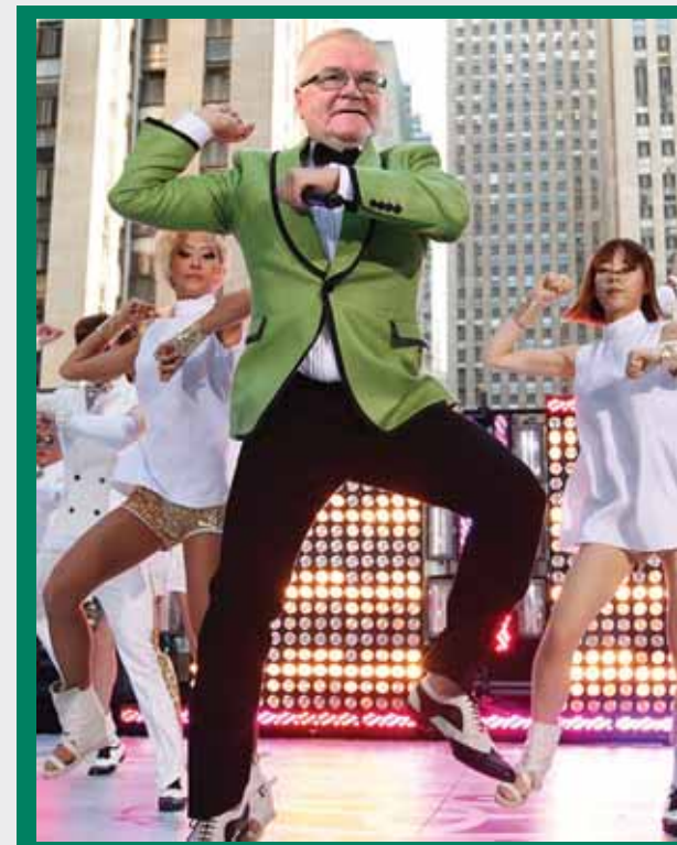
NETIPILT Edgar Savisaare blogist, kus linnapea kirjutas, et Lähte Gümnaasiumi 7.-9. kl õpilased Tartumaalt laulsid-tantsisid maailmahiti Gangnam Style ainetel loo Tallinn Style ja riputasid selle Youtoubi üles. Teised netikunstnikud on lähtelaste ideele lisanud ka lustaka linnapea pildi.