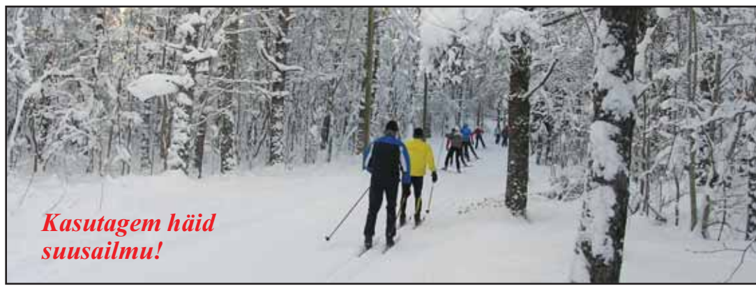
Kasutagem häid suusailmu!