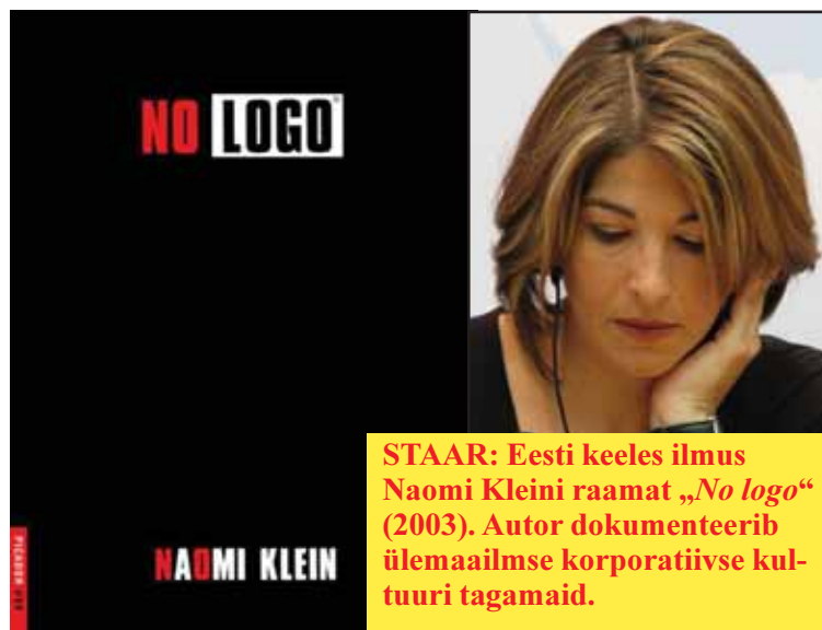
STAAR: Eesti keeles ilmus Naomi Kleini raamat „No logo“ (2003). Autor dokumenteerib ülemaailmse korporatiivse kul- tuuri tagamaid.

inspireerides ja innustades inimesi uskuma paremasse tulevikku. Ei saa ju hom- mikust õhtuni kuulata Ligi- suguste pessimistlike eksper- tide hingetuid majanduskalku- latsioone, mis ennustavad vaid kriisi jätkumist, vaesust ja tööpuudust, ning pidada seda normaalseks.