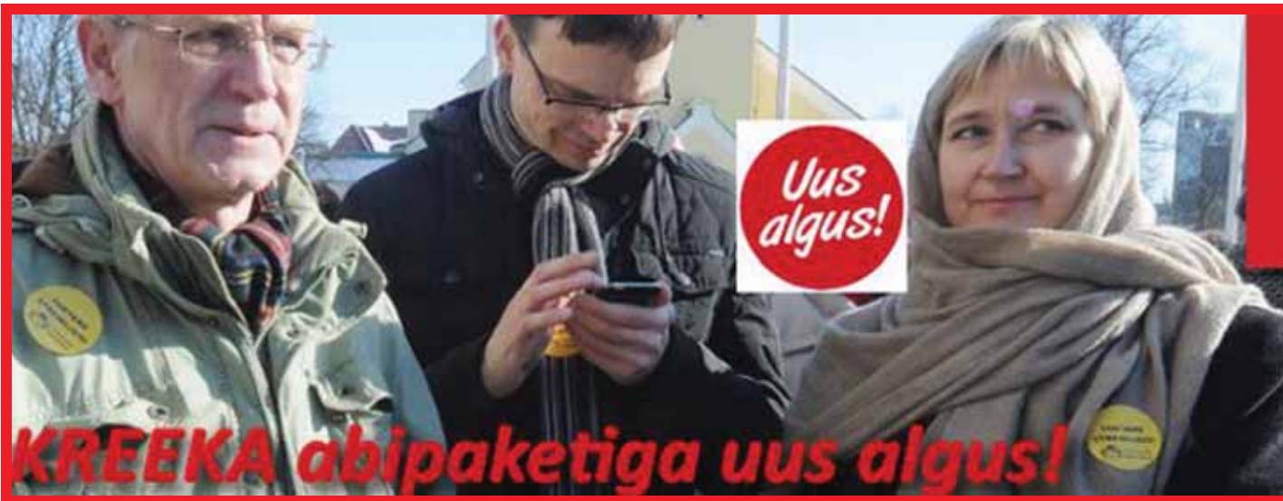
SILMAKIRJATSEJAD: Enamus nn. „valitsuskriitilisi“ sotse hääletas nii Kreeka abipaketi kui ESM-iga liitumise poolt. Fotokujund pärit Facebooki kontolt „Hinnatõus teeb haiget“.

Niisiis on loodud pinna kauplemiseks võimuparteiga, kuid samas ei taheta käest anda ühtki