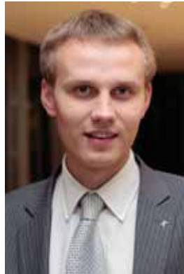
PRIIT TOOBAL Riigikogu liige

Reformierakonna, IRL-i ja hulga sotsiaaldemokraatide juhtkonna hääle abil Riigikogus tehtud Euroopa Stabiilsusmehhanismi (ESM) toetamise otsus tähendab Eesti riigile kohustust aidata endast jõukamaid riike. Keskerakond selle otsusega nõus ei olnud ning hääletas sellele vastu.