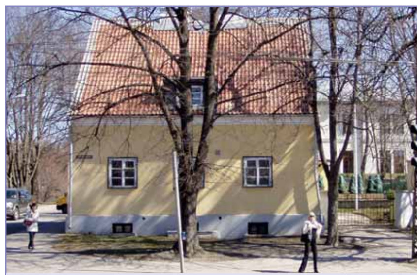
KURIKUULUS MAJA: Kesknädal kirjutas esimest korda Villa Jacoby ehk IRL-i maja kahtlastest müügitehingutest tänava 30. mail.