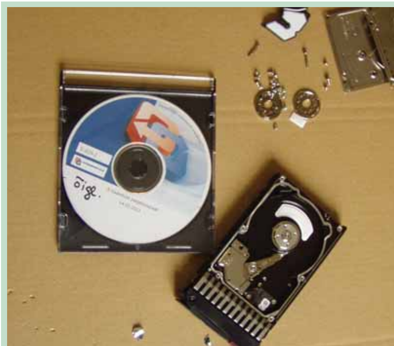
Elektrooniliste hääle hävitamine 11.04.2011 sisaldas serveri ketta lahtivõtmist ja füüsilist hävitamist.

Nende probleemide väljatoomise järel võiks küsida, kas e-hääletuses on ka midagi positiivset. Ennekoike on selleks hääletamise ühetaolisus või võrdsus – valija kohta läheb