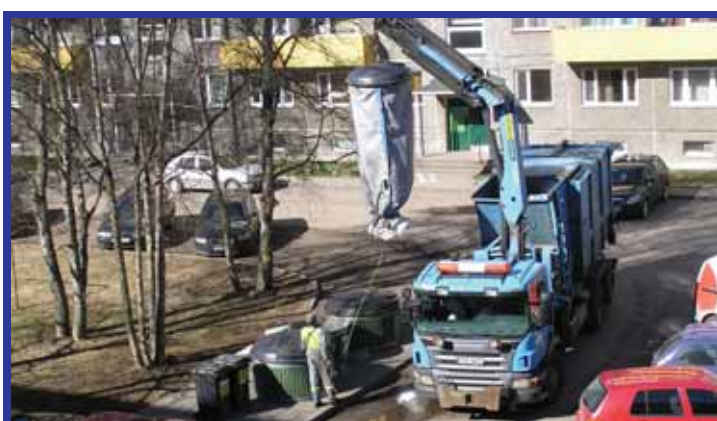
Mitmeti sorteeritud prügitonnis, mida asumitest ära veetakse, moodustab lõviosa eripalgeline taara. Kui see läheb põletiseks kesk-kütlaesse, avitab taara meie elamisi soojaks saada.

Nõukaajal oli maasvedeleva taara kokkukorjamine töötutele hea teenistus, sest klaastaara osteti tagasi. Nüüd enamik taarat müüakse koos kaubaga ühe-