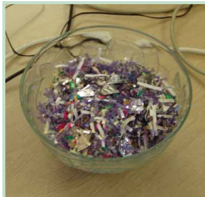
Elektrooniliste hääle hävitamine 11.04.2011 sisaldas serveri ketta lahtivõtmist ja füüsilist hävitamist.

Autori fotod hääle hävitamiselt Vabariigi Valimiskomisjoni ruumides Toompeal.