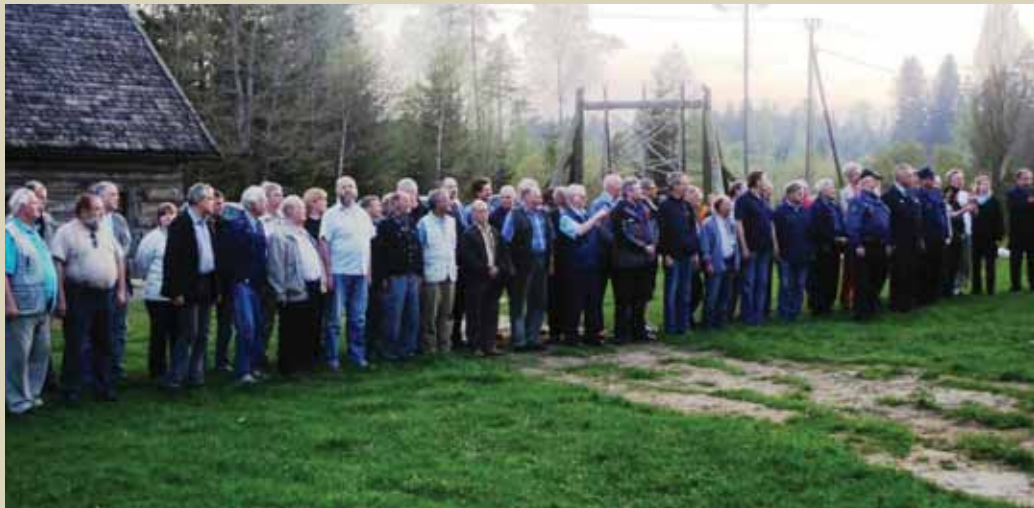
RIVISTUS: Kodukaitsjad 20 aastat hiljem. Kokkutulek Saku vallas Metsanurme külas Rehemetsa talus.

Kodukaitsse Tallinna maleva liige 16. maist 1990