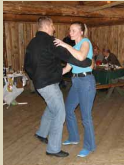
PIDU: Nagu iga pidu, lõppes ka kodukaitsjate kokkutulek tantsuga. Arhiivifotod