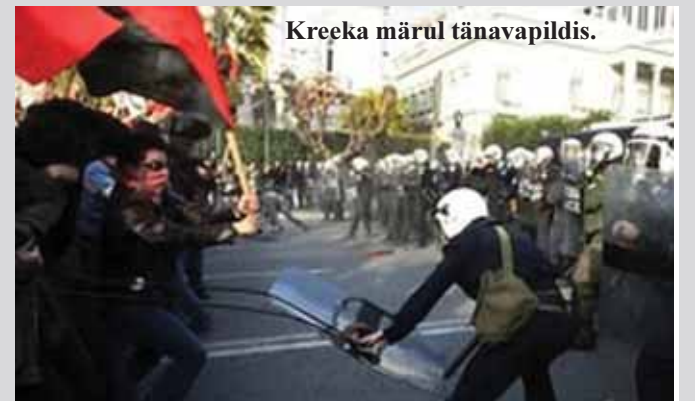
Kreeka märul tänavapildis.

Ehk, ja seda pole avalikult palju välja öeldud: raha ei ole. Tegelikult pole raha ka Saksamaal, sest kui Kreeka läheneb pankrotti, ehk jätaks omakohustused Saksa pankade ees tasumata, siis järgneks sellele Saksa majanduse ja kogu Saksa riigi kollaps. See, mis praegu toimub, ja mitte ainult neis kodudes, kelle pereemad ja -isad üksteise järel „Tõehetke“ saate abil oma võlgu püüavad päästa, on üleilmne sms-laenamine. Seejuures paaniline sms-laenamine. Kus võetakse üha uusi ja uusi, üha kallimaid laene vanade laenude tasumiseks, lootuses, et ükskord