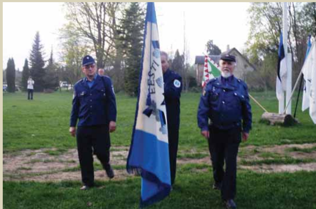
LIPP: Kokkutulekul otsustati Eesti Kodukaitsse lipp anda hoiule Eesti Politsei- ja Piirivalveameti muuseumile.