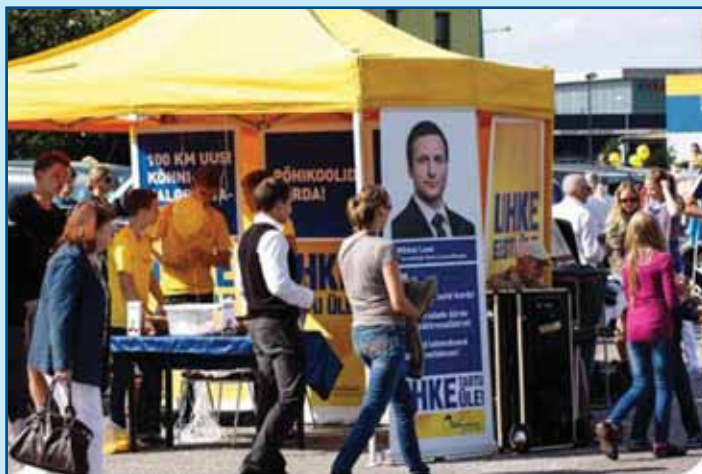
REFORM TEEB KESKI: Reformierakonna telk Tartu sügislaadal. Telgid tõi Eesti valimiskampaaniasse Keskerakond.

Ei mina ega Rahvamuuseumi Tõnis neid ameerikalikke nimemalle ilmselt ei kasuta. Aga poliitiliselt küpsed ja demokraatlikke traditsioone austavad inimesed ei lähe teistele ütleva, millist stiili, kas siis eesti või ameerika oma, nood kasutama peavad. Seda enam, et