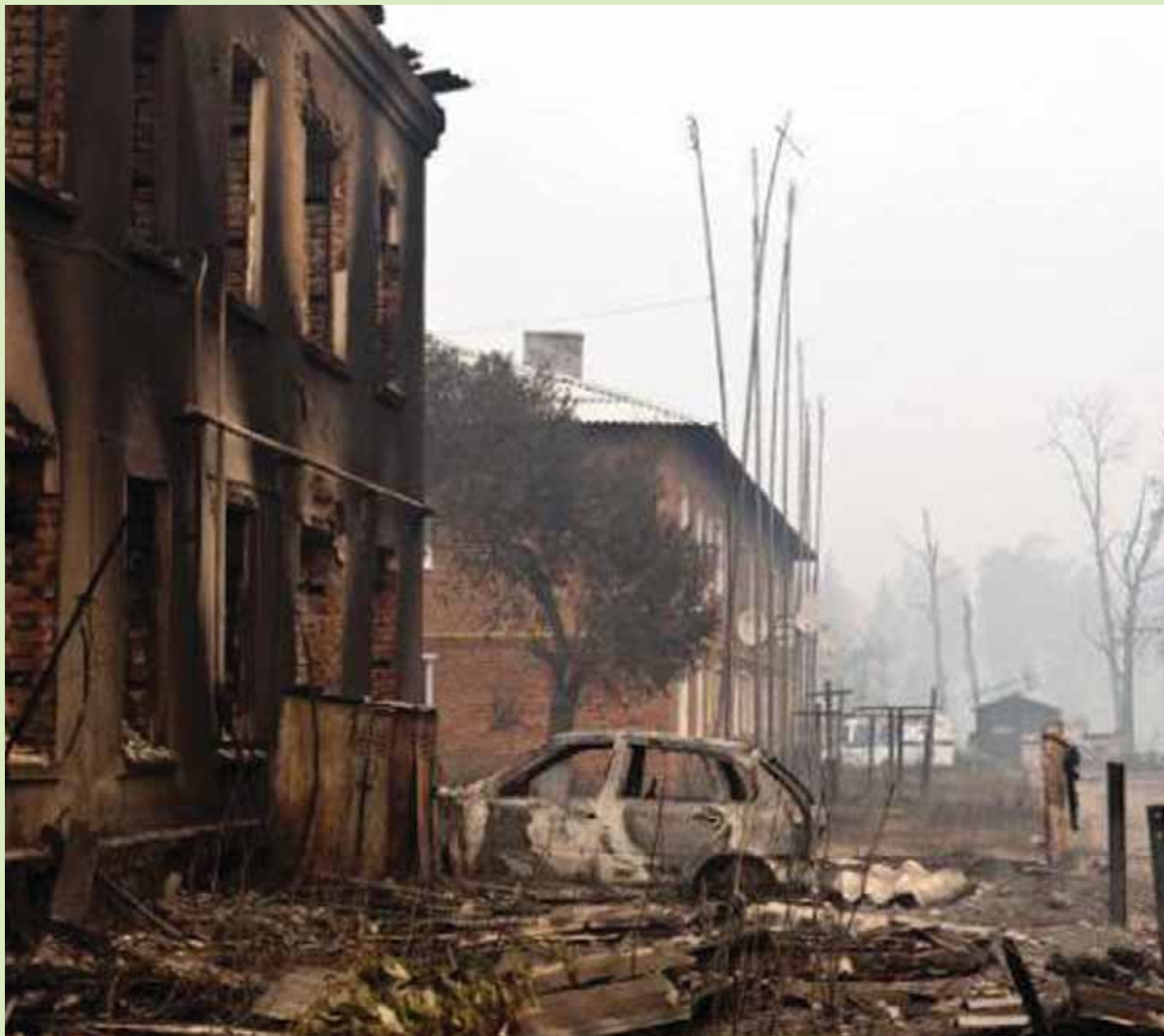
PUHASTUSTULI: Eelkõige provintsis on Venemaa üks suurimaid probleeme – vana ja lagunev elamufond – laastavate tulekahjude tõttu oma lahendust leidmas. Külmade tulekuks lubavad võimud kõigile tulekahjus kannatanutele nõelasilmast tulnud elamise ning kompensatsiooni kaotatud vara eest.

eriti aktsepteerida ning ka Venemaa spetsialistid süüdistavad „vägilasi“ täielikus majanduslikus tõpluses. Ilmselt mitte alusetult. „Vägilastel“ on Venemaal suur, aga mitte absoluutne võim. Samas esineb nende puhul mitu olulist kitsaskohta.