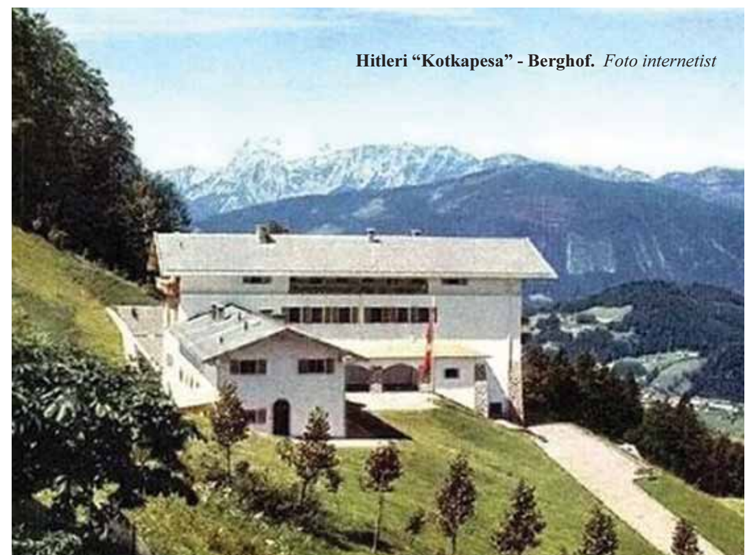
Hitleri "Kotkapesa" - Berghof. Foto internetist

Kohtumispaik, mis pidi külalistele avaldama jõulist muljet, näitama võõrustaja suursugust ja võimsust, lisama karmile poliitikale esteetilist värvingut. Juba juurdepääs sinna on muljetavaldav. Tee, mis viib alumiselt platvormilt ülemisele, on müstilne – nii all kui ka üleval püstloodsed kaljuseinad. Ülemiselt platvormilt kuni liftini minnakse tunneli kaudu 124 meetrit kalju sisse. Sõit tippu kestab kiiskavast messingist ja peegli- ja liftis 42 sekundit. Vaade, mis siis avaneb, on võimas – muu maailm jääb pool kilomeetrit