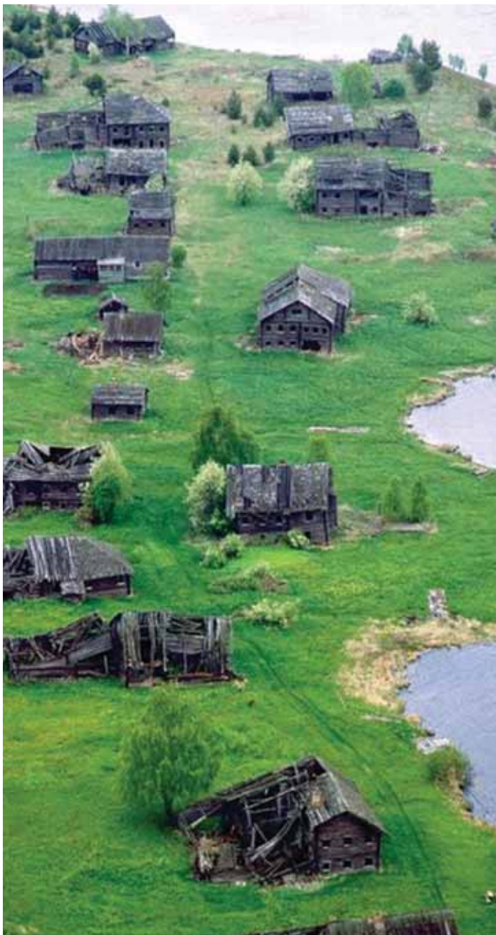
TÜHERMAA: Täna maaelu- ja hariduspoliitika puhul näevad Eesti maarajoonid varsti välja just sellised.

inimestel uus võimalus luua endale ise töökohti. Et oleks võimalik säilitada isatalu, kasvatada üles lapsed, kes armastavad oma kodukohta ja suure tõenäosusega jätkavad isa-