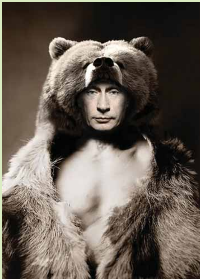
VÄGILANE: Putin on just karu „taltsutanud“.

Osaliselt lahendati kapitali probleem oligarhide vara bruttaalse ümberkandimisega (meenutagem Bereskovskit ja Hodorkovskit). Ometi ei soovita Läänes seda kontingenti