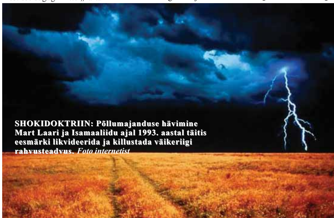
SHOKIDOKTRIIN: Põllumajanduse hävimine Mart Laari ja Isamaaliidu ajal 1993. aastal täitis eesmärgi likvideerida ja killustada väikeriigi rahvusteadvus.

Peaksime sarnaselt Soomega hakkama oma teraviljaseemne tootmist subsideerima. Siin on üks väljapääsudest. Mitte ainult Sangaste rukist, vaid iga-