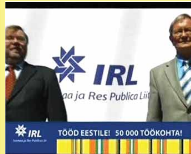
IRL-i lubadused ja tulemused on vastupidised.

2007. a. Riigikogu valimiste järel olid valitsuse moodustanud Reformierakond, IRL ja SDE ning nende valitsusaeg oli alanud Pronksiööli ühiskondliku terviklikkuse lõhkumise ja transiidi ebavajalikuks kuulutamise. Eirati läheneva majanduskriisi märke. 2008. aasta suveks miinusesse langenu SKP-d raviti maksude ja aktsiiside tõstmisega ja eelarve kärpimisega. Tulemus oli soovitud vastupidine, aga riigile aadri laskmisega kooskõlas. Uue töölepinguseaduse jõustumise eel oli 30. juunil 2009 aastaga juba kadunud 54 547 töökohta (veel alles 621 880) ning majanduse rüüstamine jätkus. 30. juunil 2010 oli alles 572 444 töökohta ehk muutus aastaga (-49 436). Võime järeldada, et IRL-i lubadused on pöördvõrdelised: kui lubatakse 50 000 juurde teha, siis tegelikult kaotatakse (-49 436). Kahe viimase aastaga on Andrus Ansipi valitsus likvideerinud 103 983 inimese töökohad, näitab Haigekassa statistika. Viimase viie aasta jooksul on olnud Haigekassas kindlustatuid arvel vahemikus 1 268 631 (30. juuni 2010) kuni 1 287 575 (30. juuni 2008), muutus 18 944 inimest. Seisuga 1. jaanuar 2010 elas Eestis 1 340 127 inimest ja igasuguse haigekassakindlustusega oli juuni lõpul 71 496 inimest.