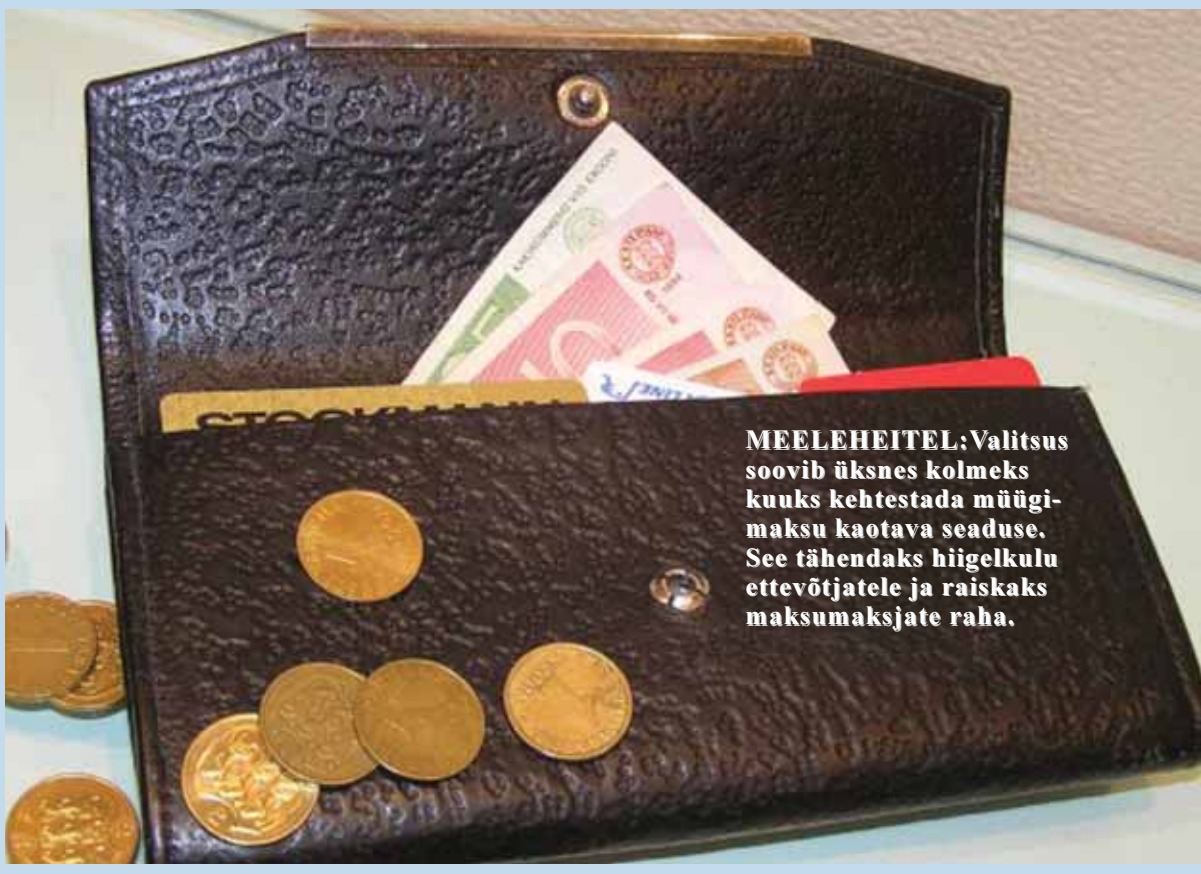
MEELEHEITEL: Valitsus soovib üksnes kolmeks kuuks kehtestada müügimaksu kaotava seaduse. See tähendaks hiigelkulu ettevõtjatele ja raiskaks maksumaksjate raha.

Ansipi juhitava parempoolse valitsuse agoonia on lõppfaasis ja midagi positiivset sealt enam tulemas ei ole. Müügimaksu kehtestamine näitas, et tugevalt juhitud omavalitsused suudavad koos oma territooriumil elavate inimeste ja tegutsevate ettevõtetega leida lahendused arenguks ning majan-