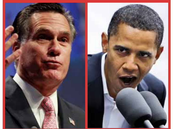
KONKURENDID: Mitt Romney (vasakul) astub tõenäoliselt vabariiklaste kandidaadina vastu Barack Obamale USA presidendivalimistel.

Kindlasti saavad presidendikampaania lõppvaatuses oluliseks ka tööpuudus ja majanduse olukord. Demokraadid said valitsusvastutuse olukorras, kus oli puhkenud majanduskriis. Täna tuleb neil valijatele tõestada, et ilma majanduse elavdamise programmidega oleks olukord