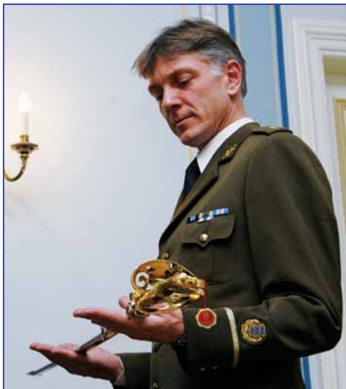
ÜKSI TEGIJA: Indrek Tarand sai Europarlamendi valimistel 40 000 häält rohkem kui terve Reformierakond kokku.

Keskerakond on juba korduvalt rõhutanud, et lõhe erakondade toetajaskonna ning erakondadesse uskumisest loobunute vahel on liiga suur. Just sellise lõhe suurenemine on ohtlik ühiskonna stabiilsusele ja Eesti poliitika arengule. Veelgi enam, sellise lõhe