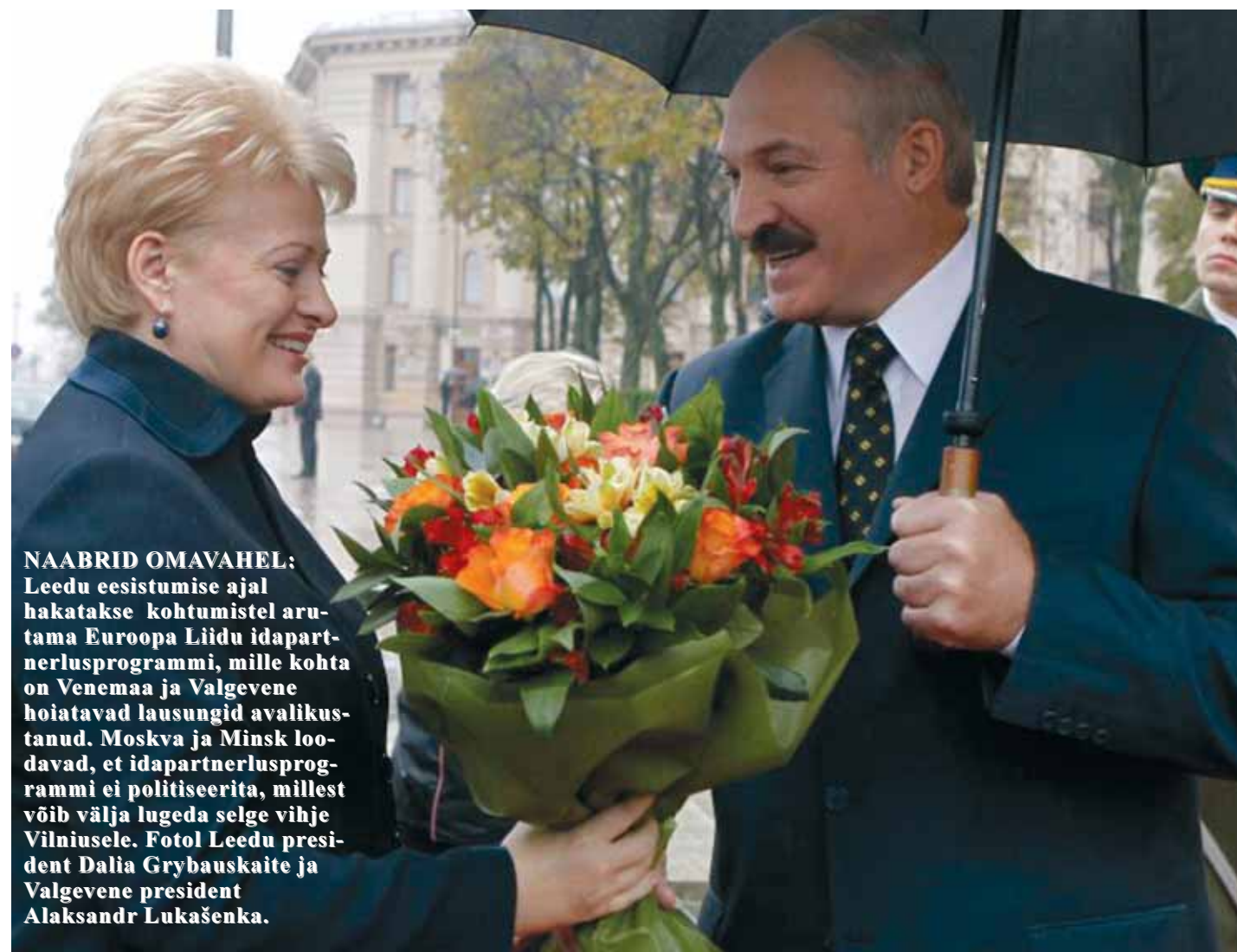
NAABRID OMAVAHEL: Leedu eesistumise ajal hakatakse kohtumistel arutama Euroopa Liidu idapartnerlusprogrammi, mille kohta on Venemaa ja Valgevene hoiatavad lausungid avalikustanud. Moskva ja Minsk loodavad, et idapartnerlusprogrammi ei politiseerita, millest võib välja lugeda selge vihje Vilniusele. Fotol Leedu president Dalia Grybauskaitė ja Valgevene president Alaksandr Lukašenko.

Loodetavasti annab eesistumispoolaasta soodsa tõuke ka Leedu majanduskasvule. Täna on riigist töötus 11,5%, riigieelarve defitsiit -2,5%, riigivõlg ligi 40%, inflatsiooniprotsent 2,4 aasta lõikes. Õnneks oodatakse tänava Leedu SKP