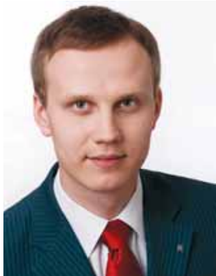
PRIIT TOOBAL Riigikogu liige

Suure tõenäosusega ei mõtle inimesed igapäevaselt arvatud kasutades sellele, et igast nende hiireklõpsust jääb maha jälg, justkui muinasjutulik leivapuru, mida mööda saab arvutikasutajale virtuaalses maailmas hõlpsasti järgneda. Infotehnoloogia areng on viimase kümne aastaga läbi teinud nii tohutu arengu, et tavakodanikul on juba raske jälgida, millised võimalused on selles valdkonnas tekkinud. 10. juuli Kesknädalas ilmus väga huvitav artikkel, mis kirjeldas nii Edward Snowdeni saagat kui ka võimalusi infotehnoloogia abil inimesi kontrollida, ning andis ühtlasi ainekst järgmiseks mõttekäiguks.