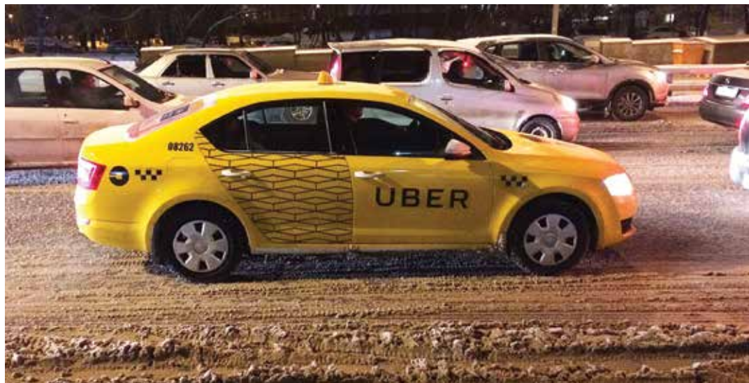
UBER MUUTUB TAKSOKS: Uber on muutumas sõidujagajast plafoonita taksoks, nagu pildil olev Uberi auto Moskva tänavatel.