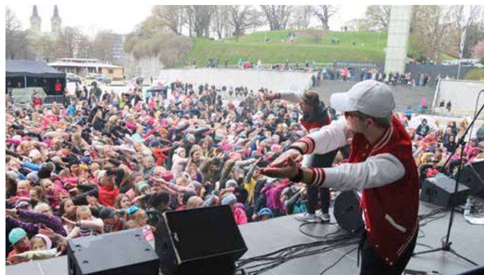
Eesti youtuber ’id korraldasid Vabaduse väljakul flash mob ’i. Lava ette oli kogunenud umbes 500 tantsuhuvilist.

„Varasemad kohalike omavalitsuste valimised on näidanud, et madalat toetust omanud erakonnad võivad valimispäeval saada toetajaskonna hüppelise kasvu, kuid selleks vajab erakond tugevat liidrit,“ tõdes Eesmaa, kinnitades omalt poolt, et uus esimees on ennast liidrina korduvalt tõestanud nii IRL-i volikogu esimehena kui ka põllumajandusministrina mõlemas Ansipi valitsuses. Kn