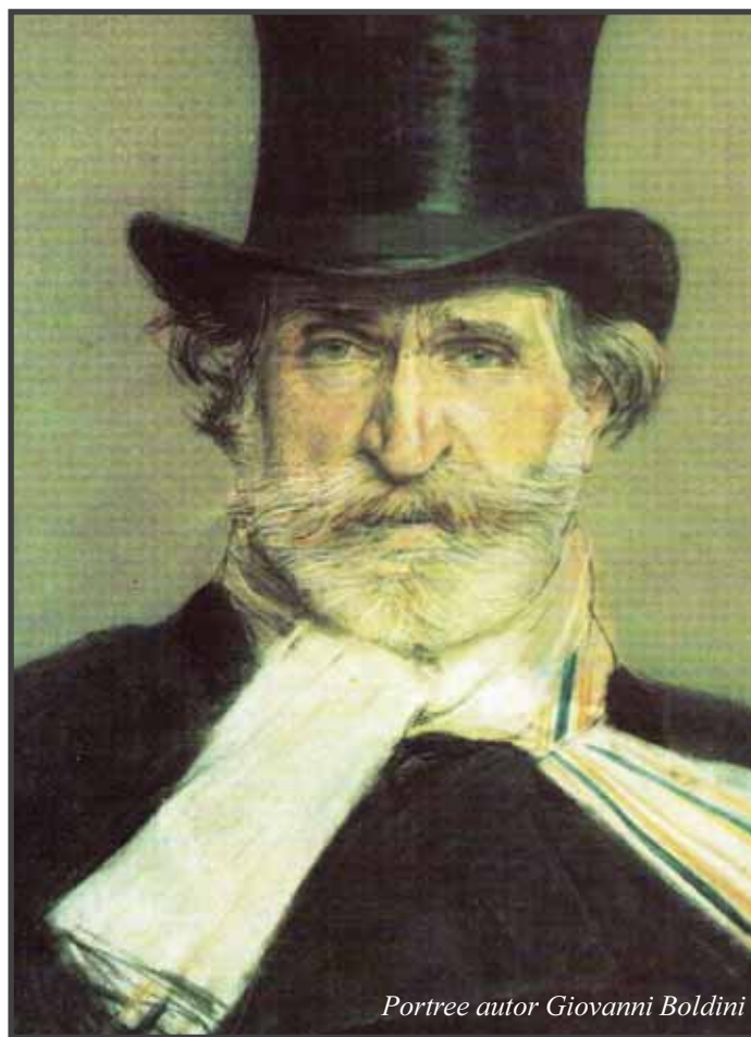
Portree autor Giovanni Boldini

„Nabucco“ järgnesid vaid aastaste vahedega „Lombardlased“, „Ernani“, „Attila“ ja