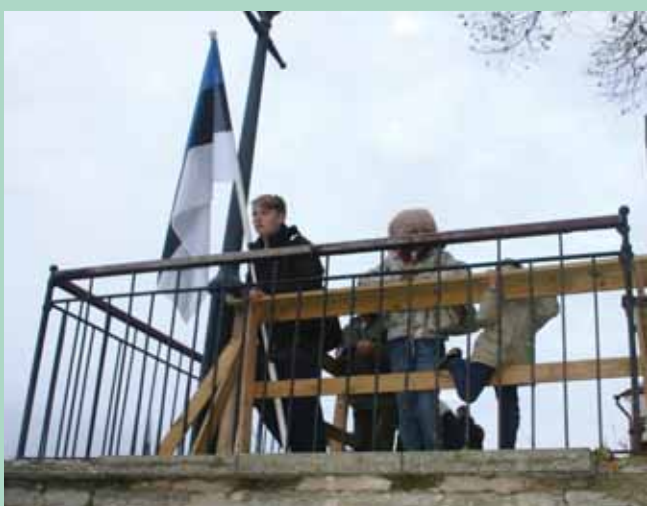
EESTI ENNEKÕIKE: Kogu ürituse jooksul hoiti Eesti lippu kõrgel, sest eelkõige tuldi välja muret avaldama oma kodumaa saatuse pärast.