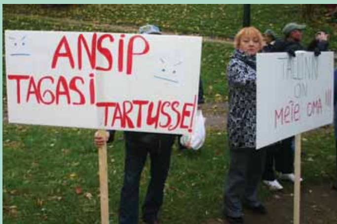
TÜDIMUS PEAMINISTRIST: Meeleavaldusel osalejad väljendasid oma pahameelt peaministri suhtes, kelle valitsemise ajal Eesti elu on liikunud allamäge.