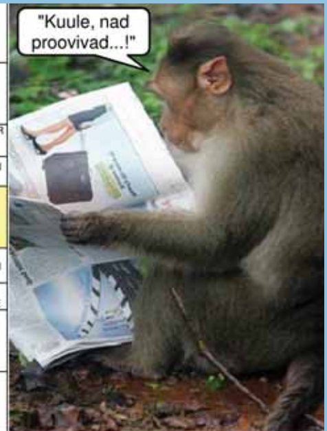
"Kuule, nad proovivad...!"