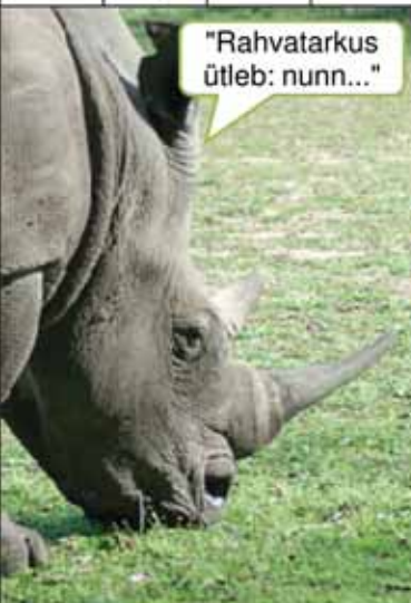
"Rahvatarkus ütleb: nunn..."

Ninasarvik: "Rahvatarkus ütleb: nunn..." " ... proovis ka ja sai lapse." Arv: "Kuule, nad proovivad...!" " ... sind ikka maha võtta!"