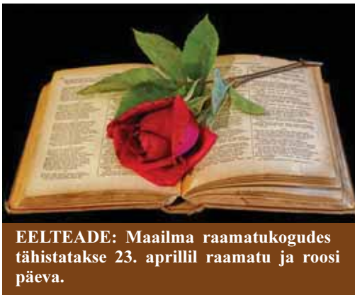
EELTEADE: Maailma raamatukogudes tähistatakse 23. aprillil raamatu ja roosi päeva.

„Imeline Ajalugu“ avaldab väga asjalikke pikki lugusid ja ka lühemaid nuppe. Üsna palju on lugusid sellest, mis on toimunud ajal eKr. Nendes lugudes on