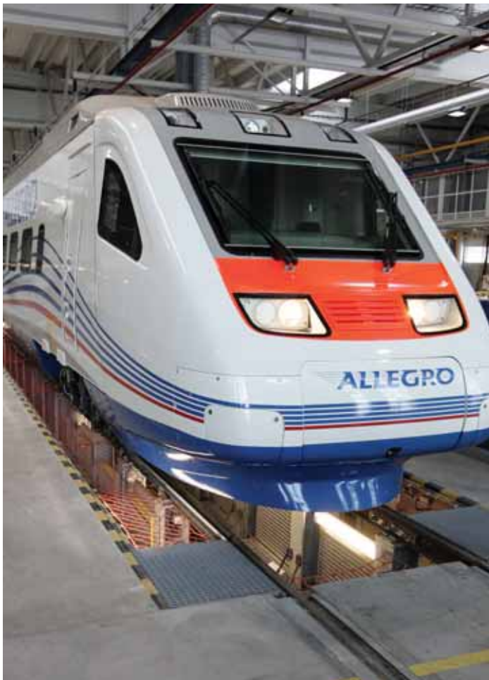
ALLEGRO: Soomlased ja venelased teevad koos unistuste raudteeliini Helsingi–Viiburi–Moskva. Eestlastele jälle kott pähe tõmmatud...

Seekord pööran rohkem tähelepanu kahele viimasele transpordiviisile, mere- ja raudteeühendusele, täpsemalt – nende kahe ühitamisele ning ühendamisele. Mõlemad on TEN-T ehk üleuroopalises transpordivõrgustikus käsitletavat transpordiviisid, mille