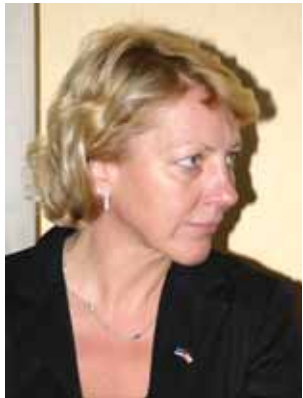
VILJA SAVISAAR-TOOMAST Eesti saadik Euroopa Parlamendis

Eesti on olnud Euroopa Liidu liikmesriik kuus aastat, rääkimata pikast ettevalmistusajast liikmeks saamiseks. Kuid veel täna, 2010. aasta lõpul, peame tõdema, et me justkui polekski Euroopaga ühendatud. Selline kurvavõitu olukord peegeldub kahjuks kõikides transpordiliikides.