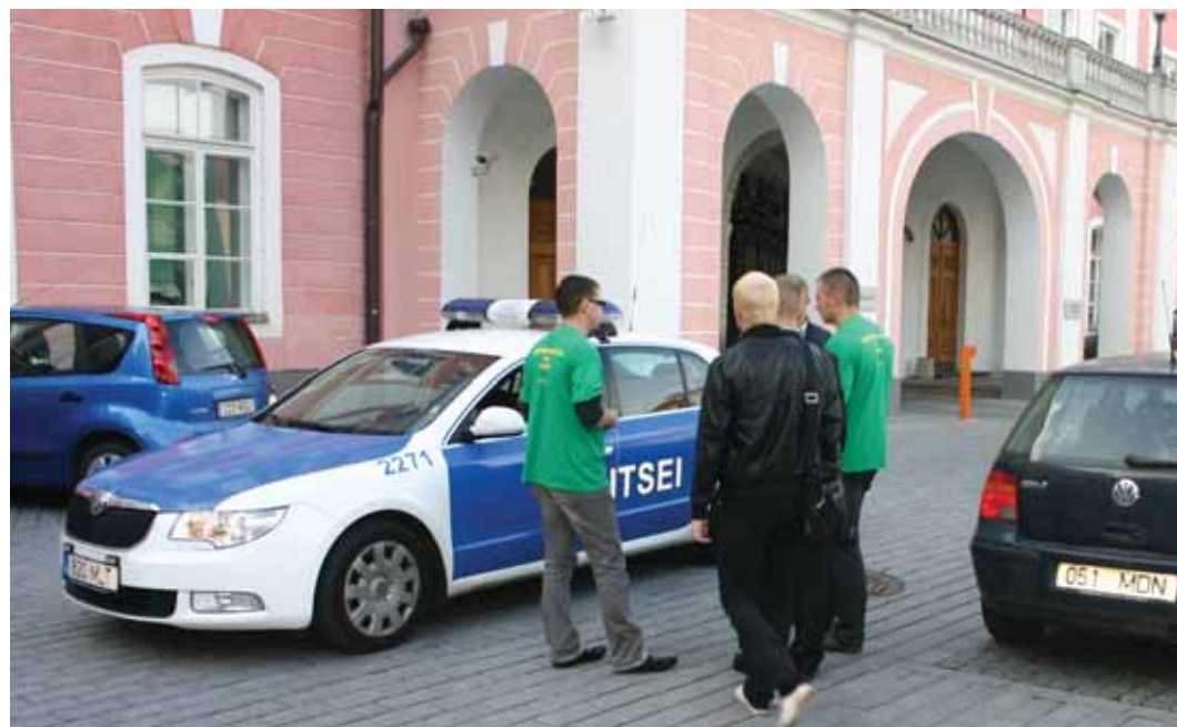
Stenbocki maja eest minema aetud noored Riigikogu ees politseile aru andmas.

Valitsuse ükskõiksus ja tegevusetus noorte töötuse suhtes on silmatorkavalt küüniline. Euroopa Statistikaameti andmetel on kuni 25-aastaste töötute määr Eestis 37,2 protsenti. Eesti on selle näitajaga Euroopas esirinnas, jäädes alla vaid Hispaaniale ja Lätile. Euroala keskmine noorte töötute määr oli teises kvartalis 19,6% ja Euroopa 27 liikmesriigi sama näitaja 20,2%. Kõige madalam määr (8,1%) oli Hollandis. Eesti oli teises kvartalis tegelikult ka kolme kõige kõrgema töötusemääraga riigi seas (18,6%), eespool olid samuti Hispaania (20,3%) ja Läti