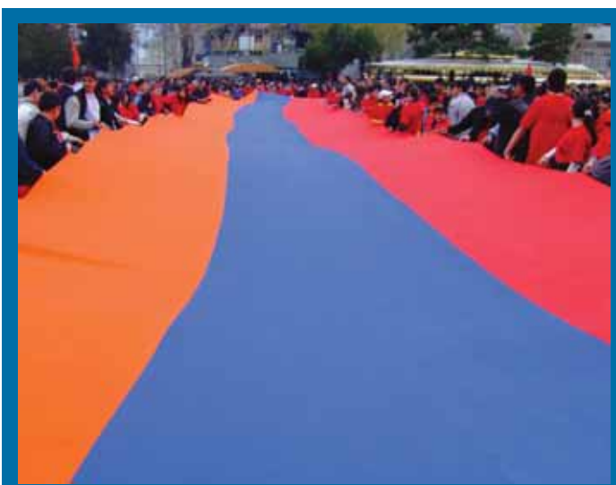
TRIKOLOOR: Kolm värvi on ajalugu, ühelt poolt lihtne ja arusaadav, teisalt väljendab täiuslikult oma riigi olemust, selle eesmärgi ja rikkust. Armeenlased Eestis tähistavad oma riigi iseseisvuse 19. aastapäeva.

Eestis elab hetkel rohkem kui 2000 Armeeniast pärit inimest. Tegutses 11 ametlikult registreeritud armeenia kultuuri-, spordi- ja noorteühingut. Armeenia diaspora peamine eesmärk Eestis on säilitada rahvuslikku identiteeti. Otsustavat rolli diaspora etnilise algupära säilitamises etendavad armeenia