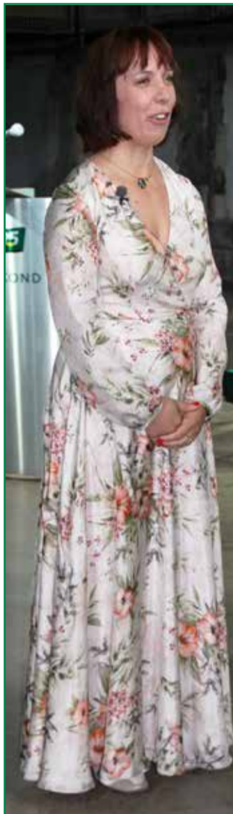
Keskerakonna volikogu valis presidendikandidaadiks Mailis Repsi.

presidendiks isegi niisugustele poliitikutele nagu näiteks Martin Helme, kes süüdistas iibeprobleemides teda intervjuueeritud lastetut naisajakirjanikku. Repsil on teatavasti viis last ja