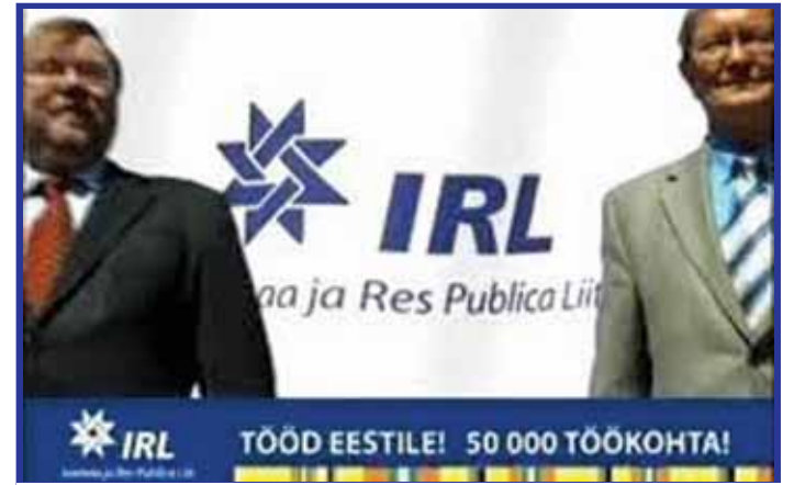
VALETAJAD: Tühjad lubadused toovad pideva võimu.

Reformierakond on pidanud kõiki neid lollusi rõõmsanäoga kaasa tegema. See oleks end õigustanud, kui vähemalt oleks pealinnas võimule saadud. Kõik need piinlikud poliitilised rünnakud on aga Savisaarest tagasi pörganud. Reformierakonnal on IRL-ist