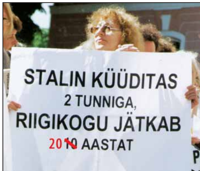
KAKS KÜÜDITAMIST: Sel nädalal möödus 70 aastat stalinlikust esmaküüditamisest ning 20 aastat omandireformi aluste seaduse vastuvõtmisest.

Vabariigi Presidendi Akadeemilise Nõukogu sise- ja rahvusliku julgeoleku komisjon