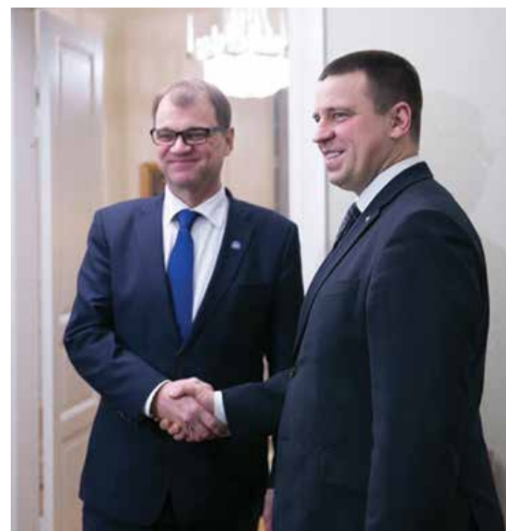
HEA KONTAKT: Soome Keskerakonna esimees ja peaminister Juha Sipilä (vasakul) tunneb tõenäoliselt rõõmu selle üle, et sai endale nüüd Eestist sobivama partneri Keskerakonna ja Jüri Ratase näol.

Toimunud muutus loob head eeldused selleks, et hõimurahvaste läbisaamine paraneks. Soome Keskerakond, mis sai tänavu juba 110-aastaseks, võitis valimised Juha Sipilä juhtimisel, kogudes 21,1% häältest. Sipilä moodustas seejärel parempoolse kallakuga koalitsiooni, kuhu kuuluvad veel Koonderakond ja Põlissoomlased. Valimistel neljandaks langenud sotsiaaldemokraadid jäid opositsiooni,