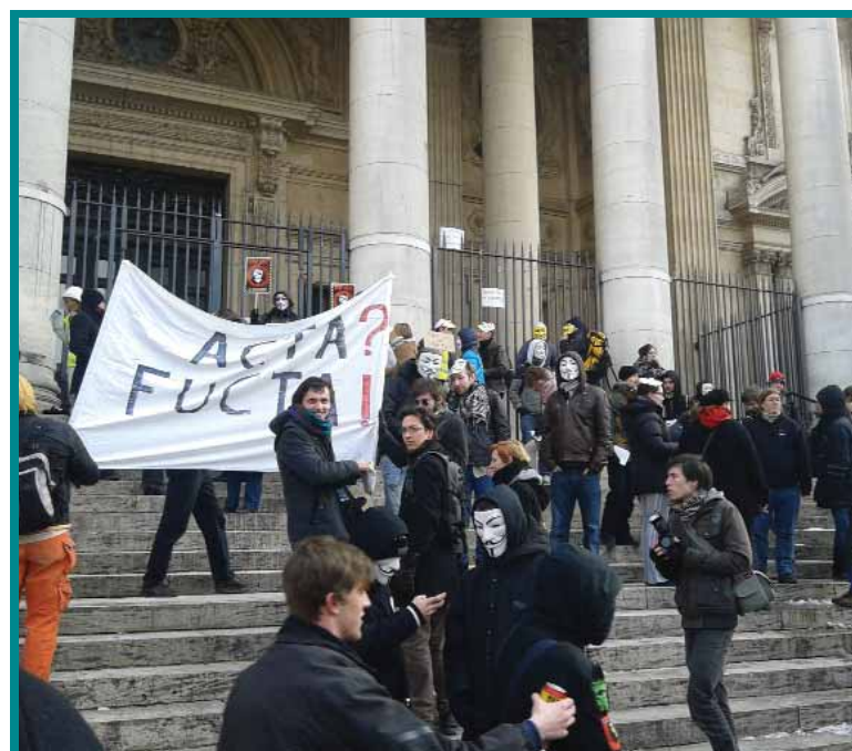
PROTESTIVAD: Järjekordne meelevallus ACTA vastu Brüsselis. Samas Euroopa Liidul puudub ühtne seisukoht ACTA suhtes.

ACTA-meeleavaldustel kritiseeriti poliitikut, et nad pole võtnud selget seisukohta. Kuid menetluse algfaasis ei olegi ju võimalik asjast täit ülevaadet saada ja oma selget seisukohta kujundada. Peab tunnustama, et ACTA vastased on teinud väga hea PR-kampaania, mille tulemusena on otsustajad juba enne diskussioone nendel „pantvangis“. Samuti ei saa väita peaminister Andrus Ansipi kombel, et ACTA on 100% täiesti ohutu kodanike õiguste seisukohalt ning et see leping ei too endaga kaasa mingeid muudatusi. Näiteks pidas liberaalist Euroopa Parlamendi saadik Marietje Schaake 8. veebruaril parlamendis toimunud ACTA-seminaril kahtlaseks Euroopa Komisjoni selgitust, et võltsimisvastane kaubandusleping ei muuda üldse Euroopa seadusandlust ning kehtestab kõigest miinimumnõuded. Sellisel juhul – milleks meile ACTA-t üldse vaja? Mitmed saadikud olid seminaril rahulolematud, et miks ACTA-t ette valmistavas protsessis pole neile antud piisavalt