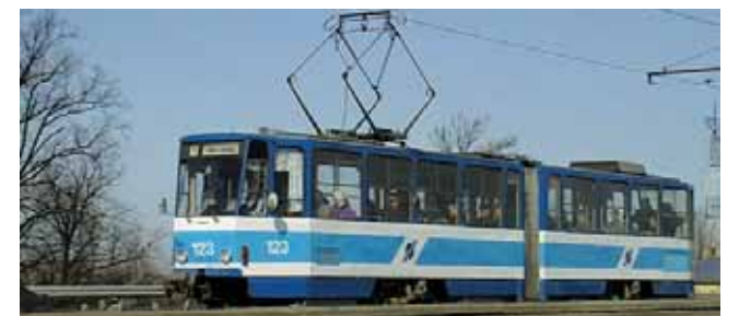
TRAMMIGALINN – see on teatud kõrgem staatus. Tallinn kavatab trammiliiklust kõvasti arendada.

Kelle pihta oli suunatud streik, mis pani seisma või lonkama ühistranspordi? Selgub, et vaesemate vastu, kellel pole autot, ja haigete vanurite vastu, kes näiteks olid mitmeid kuid oodanud eriarsti vastuvõttu ja kellele see oli määratud 8. märtsiks. Rongid ei käinud ja linnasõit arsti juurde jäi ära. Nüüd hakka kõike otsast peale uuesti ajama. Sain vastuvõtule end kirja panna 10. maiks, nii et jälle oota. Aga tervis ei oota, vaid tahab ravi.